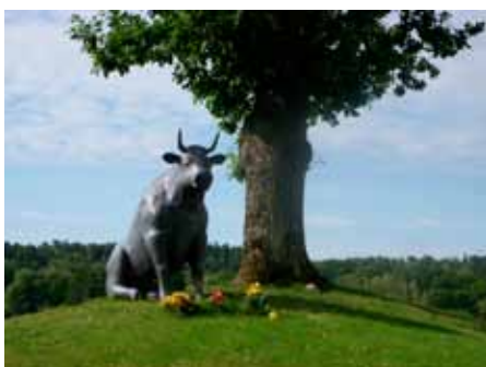
Helgö, Ekerö kommun