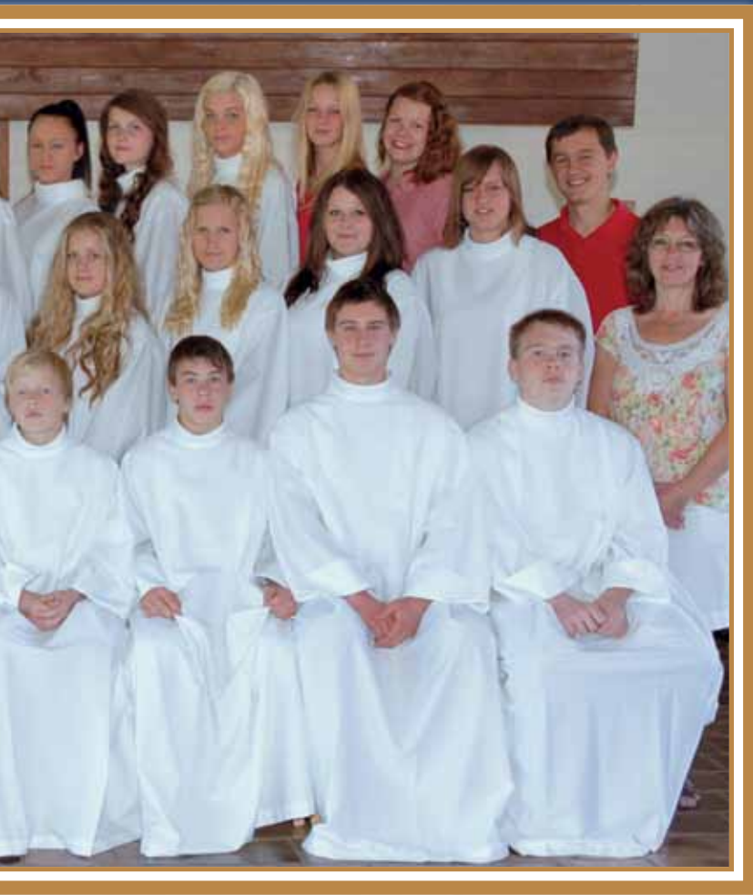
7 juli 2012 2012