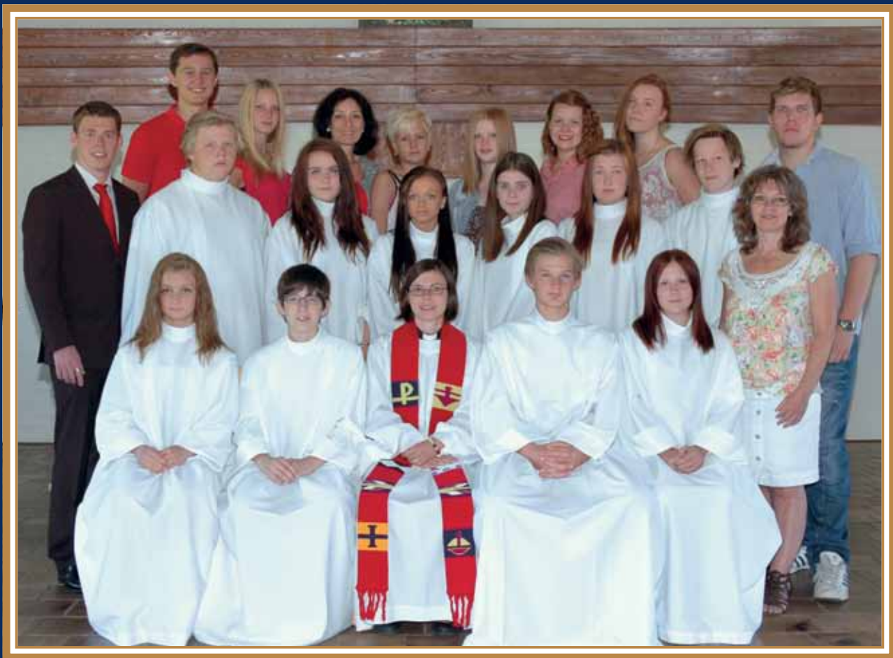
7 juli 2012