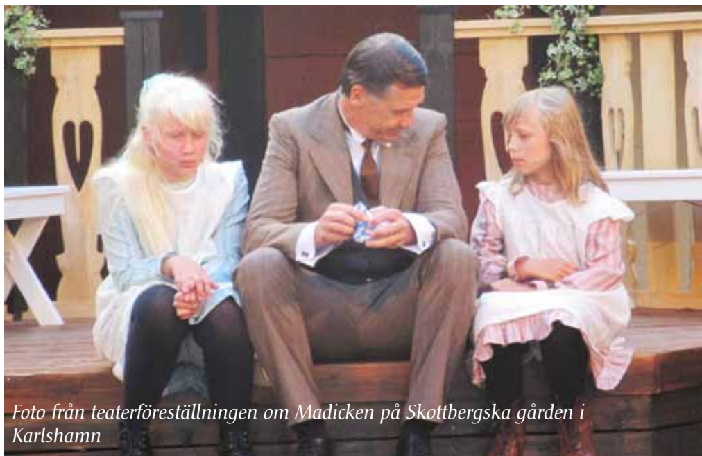
Foto från teaterföreställningen om Madicken på Skottbergska gården i Karlshamn

Då Madicken, hennes lillasyster med familj ska fira jul på Junibacken så görs det med råge. Deras stora hus har fejats och pyntats då vi får "kliva in som gästbesökare" i deras hem. Alva håller just på att garnera spädgrisen då Lisabet undrar ifall Alva vet vilken dag det är dagen därpå. Deras pappa kommer hem med en julgran som ska kläs och troligtvis har han köpt varsin julklapp till Madicken och hennes lillasyster, då han har ett bra jobb som chefredaktör på lokaltidningen. Då Madicken på lillejulafton gör ett besök hos grannen och vännen Abbe så uttrycker hon med förvåning: "– Va?! Har inte ni fått i ordning än?" Abbe svarar lika förvånat: "– Vad då fått i ordning?" Madicken upplyser om att det är