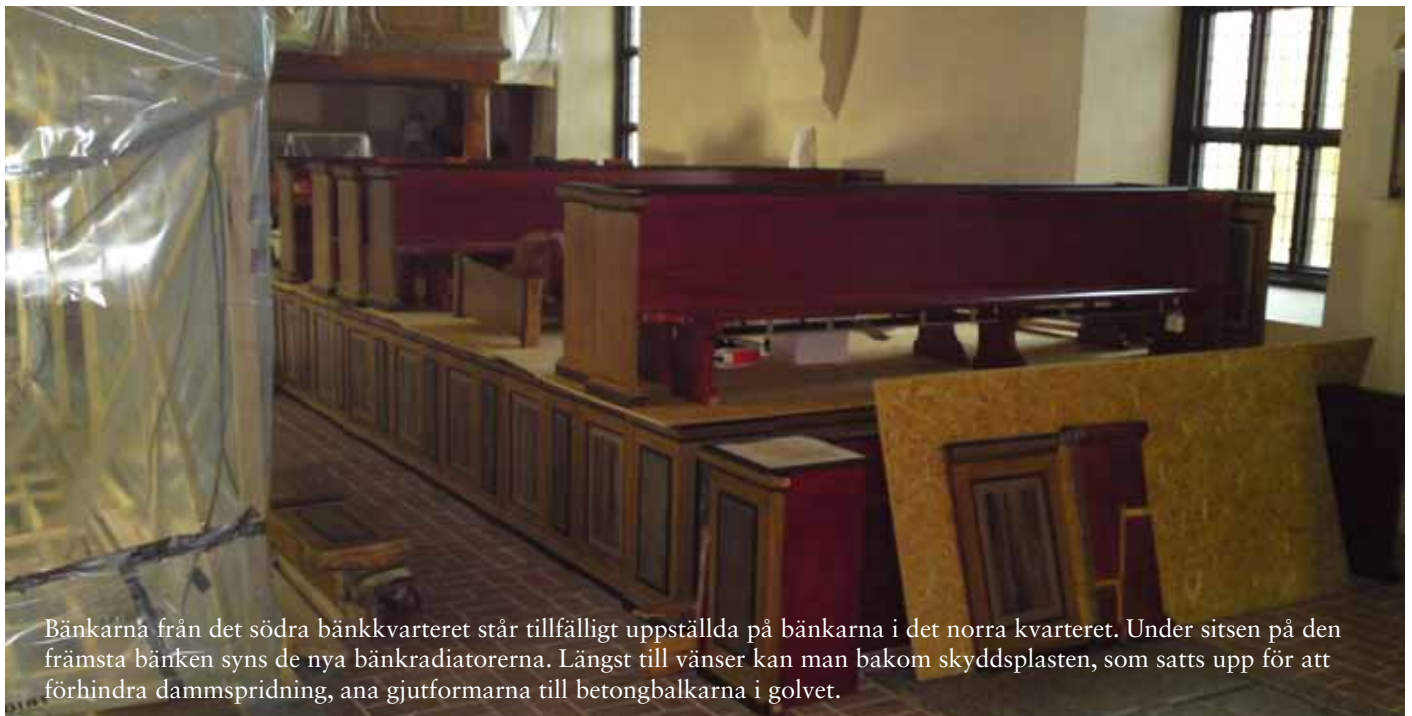
Bänkarna från det södra bänkkvarteret står tillfälligt uppställda på bänkarna i det norra kvarteret. Under sitsen på den främsta bänken syns de nya bänkradiatorerna. Längst till vänster kan man bakom skyddsplasten, som satts upp för att förhindra dammspridning, ana gjutformarna till betongbalkarna i golvet.

Kom och få information om arbetet som pågår! I Enåkers församlingshem, söndag 11 maj 18.00.