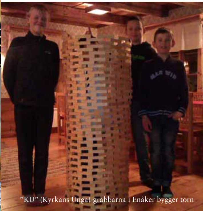
”KU” (Kyrkans Unga)-grabbarna i Enåker bygger torn