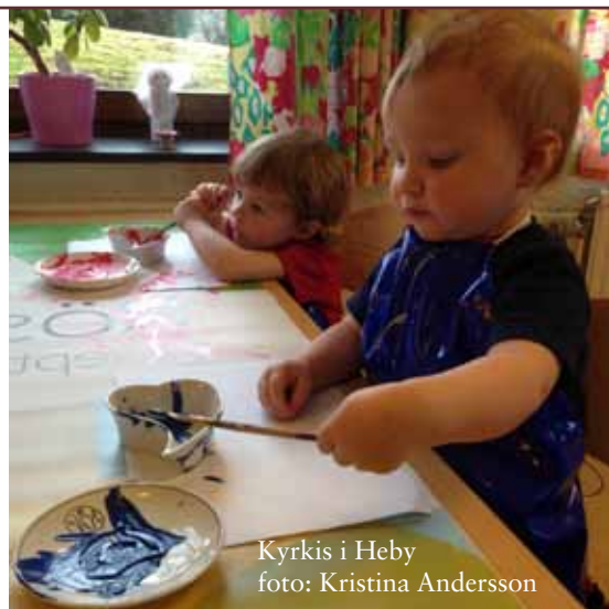
Kyrkis i Heby

Ungdomar (15+) träffas, umgås & hittar på roliga saker, Varannan onsdag 18.00-20.00 i Heby.