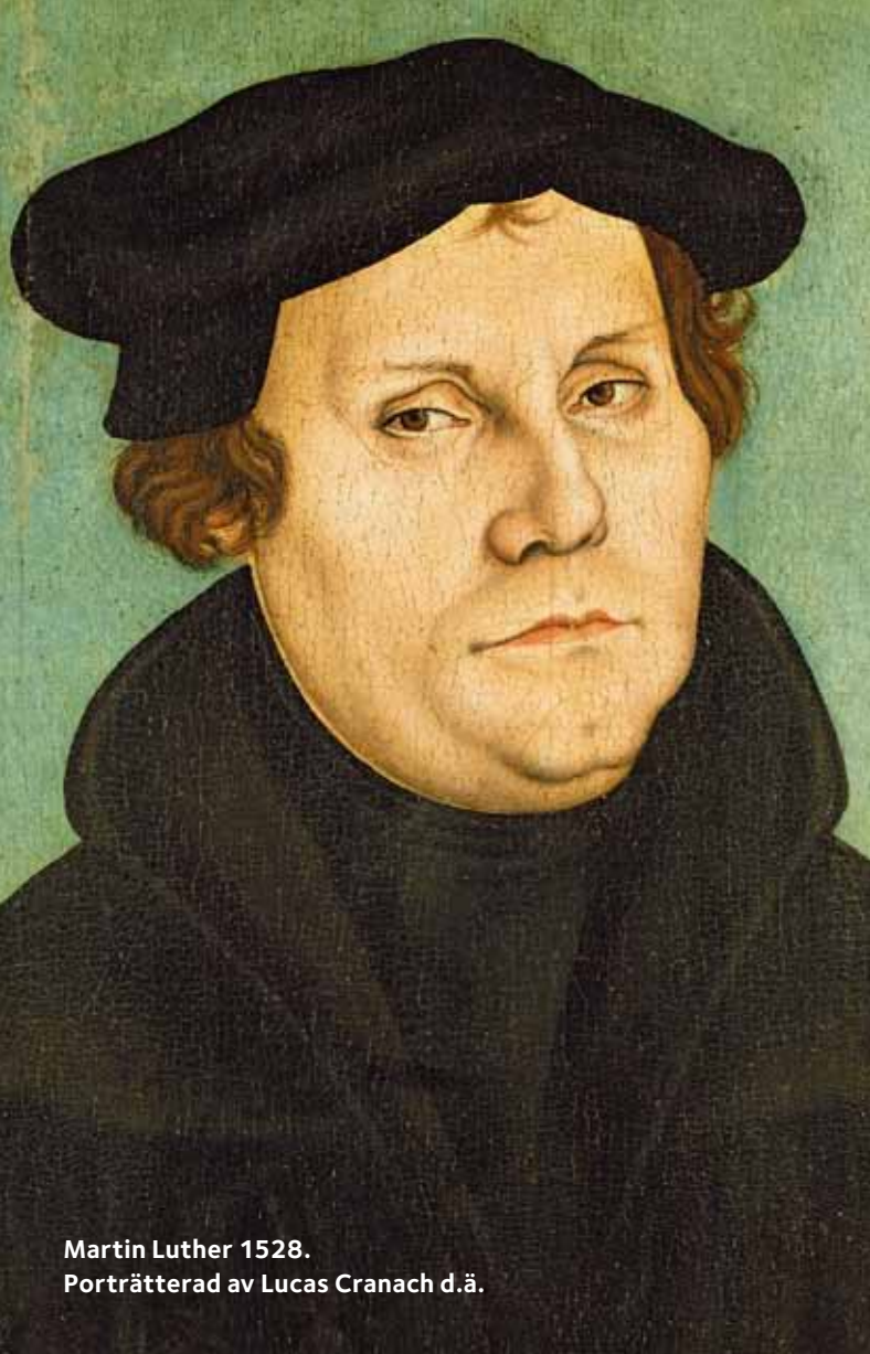
Martin Luther 1528. Porträtterad av Lucas Cranach d.ä.