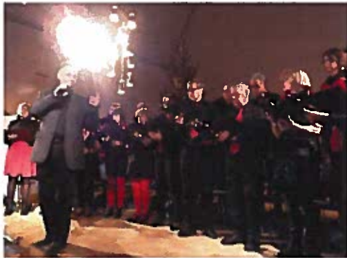
Filmpremiär med konfirmander, Det stora barnkalaset med räddningstjänsten i Skoghalls centrum, ridkonfirmander på utflykt på Kalvbergsåsen, Levande julkalender, musikalrepetition i Skoghalls kyrka.