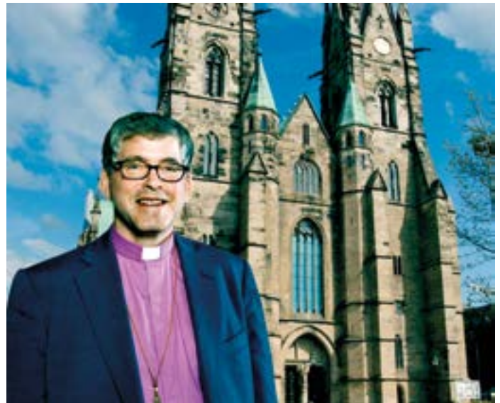
Biskop Åke Bonnier ser fram emot jubileumsdagarna 29-30 augusti då alla är inbjudna att vara med och tillsammans fira Skara stifts 1000-årsjubileum.

Skara stiftshistoriska sällskap ger ut en jubileumsbok och Posten planerar för en frimärksserie under 2014 som uppmärksammar kyrkan som kulturbärare. På Västergötlands museum handlar sommarutställningen om de 1000 åren.