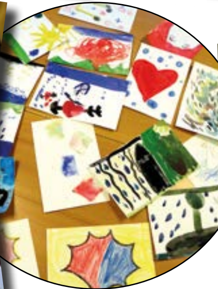
Måla till musik - Musikul, Sollebrunn