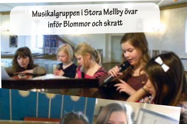
Musikalgruppen i Stora Mellby övar inför Blommor och skratt