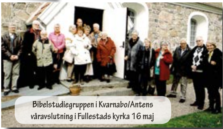
Bibelstudiegruppen i Kvarnabo/Antens våravslutning i Fullestads kyrka 16 maj