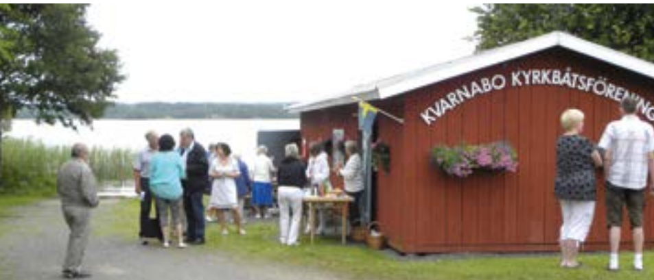
Kvarnabo Kyrkbåtsförening