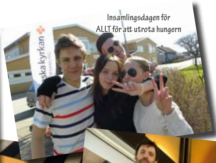
Insamlingsdagen för ALLT för att utrota hungern