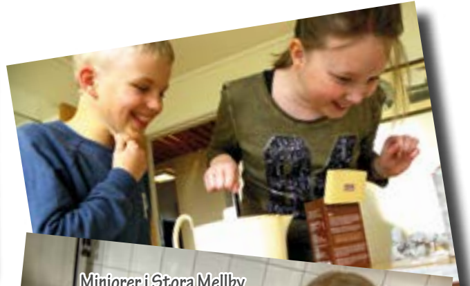
Miniorer i Stora Mellby