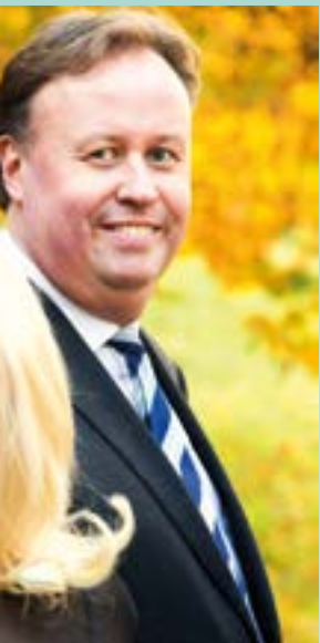
Henrik Mossberg Långareds kyrka