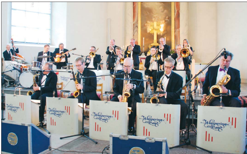
Whispering Band startades redan i början på 1930-talet och det gör bandet till Sveriges äldsta storband, och ett av de äldsta i världen. Sedan starten har man haft ett sextiotal medlemmar.