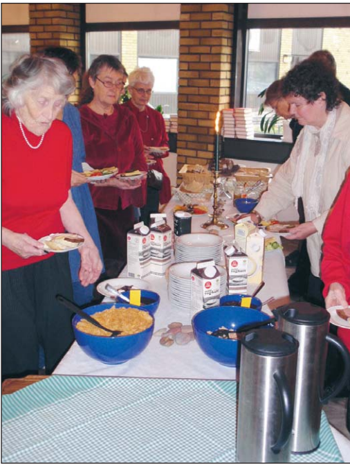
Kyrkans hus har något för alla – äldre som unga. Mat och fika blir det gärna också.