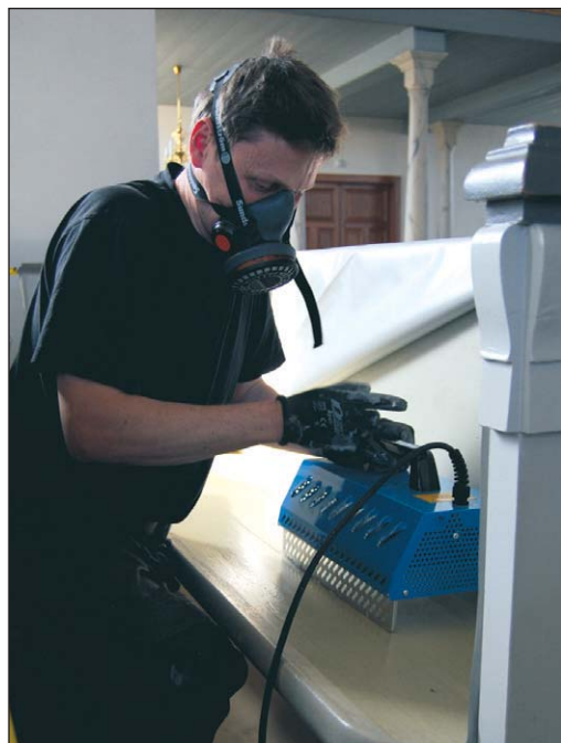
Den gamla färgen värms bort.