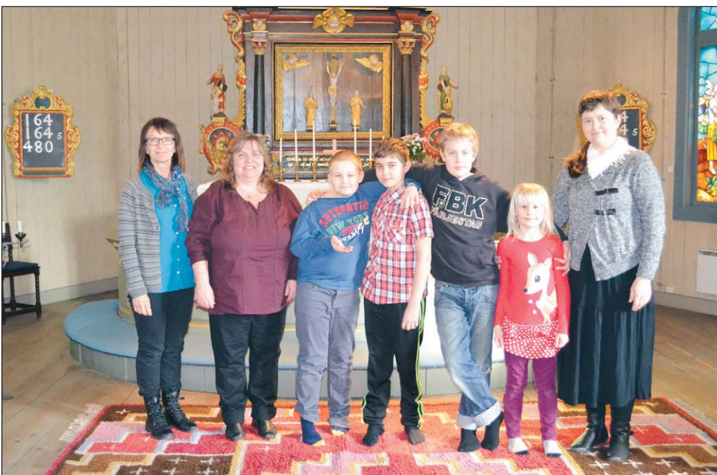
Korinterna sjunger med sina ledare.