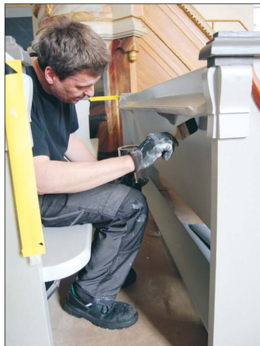
Det tar cirka 1,5 timme att måla varje bänkrad, och det finns 68 i hela kyrkan.

Men i Brattfors pågår ett omfattande ar-