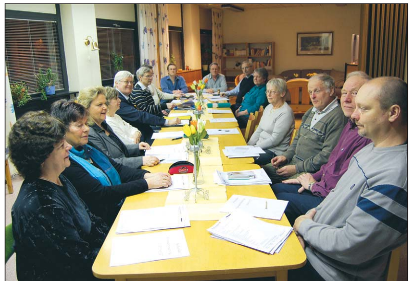
I hörnrummet är det nästan alltid något på gång. Här är det syför- eningen respektive kyrkorådet som intagit lokalen.