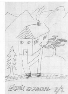
FISNIK KAMBERAJ 2/1