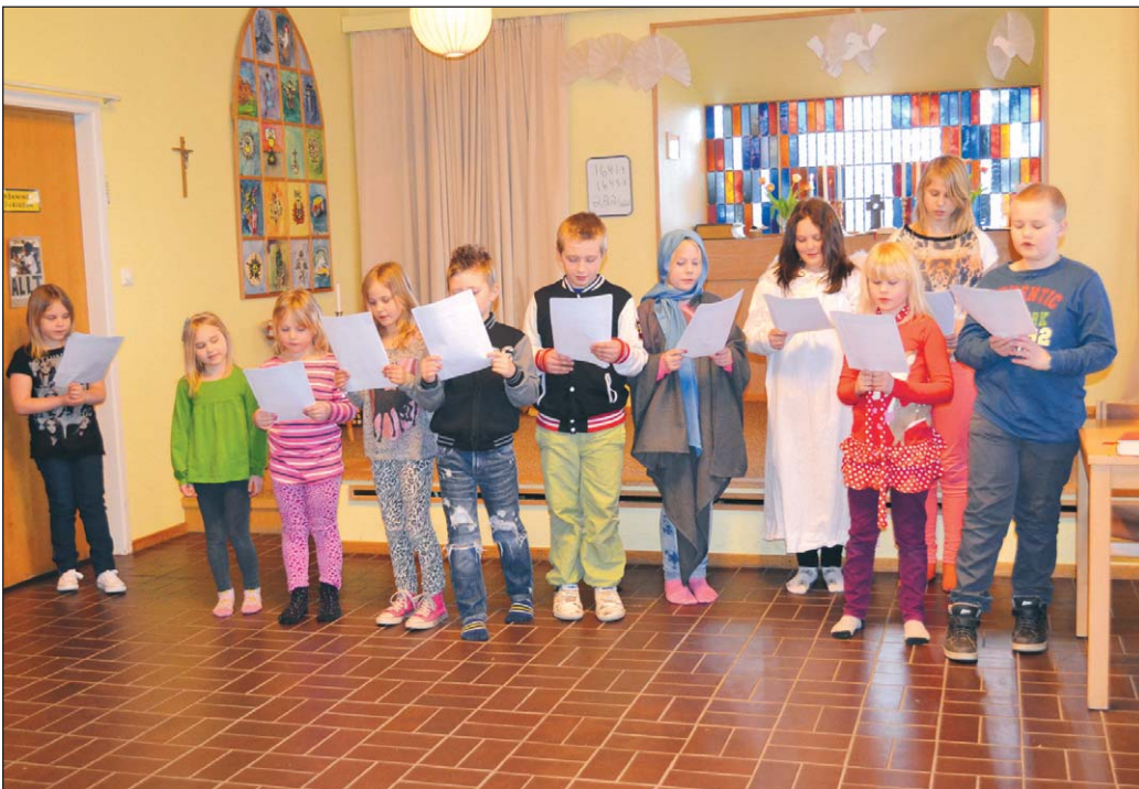
Sångfåglarna sjunger om Marie Bebådelsedag.