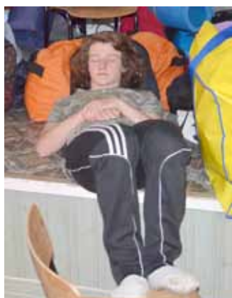
Det är jobbigt att vara på läger!