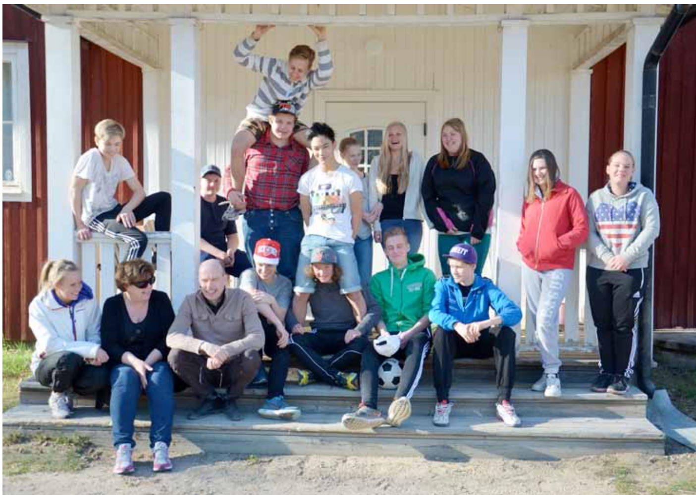
Glada konfirmander och ledare vid Björbysättern