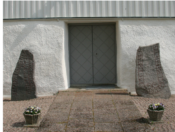
Runstenar utanför kyrkporten

Vid renoveringsarbeten under tidigt 1900-tal fann man fyra lösa bräder med rester av äldre takmålningar med änglahuvuden. Man påträffade även en solvisare av sten.