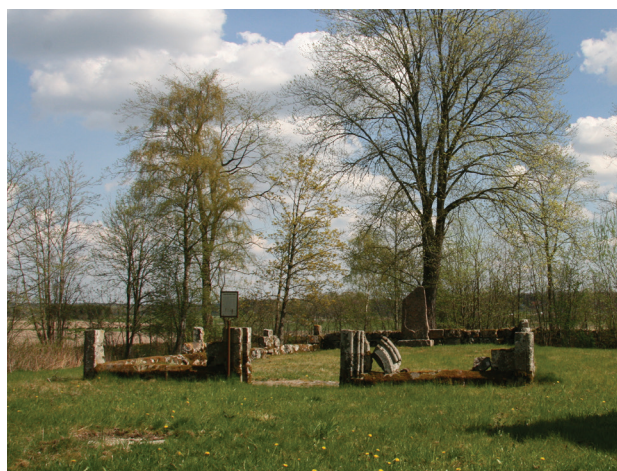
Tarsleds kyrkoruin, 2 km söder om Fölene kyrka

Kyrkstallet som är välbevarat och omsorgsfullt utformat står vid vägen nära huvudingången till kyrkogården med ena väggen upplagd på kyrkogårdsmuren. Huset representerar en numera ofta försvunnen byggnadskategori som vittnar om tiden före bilarna.