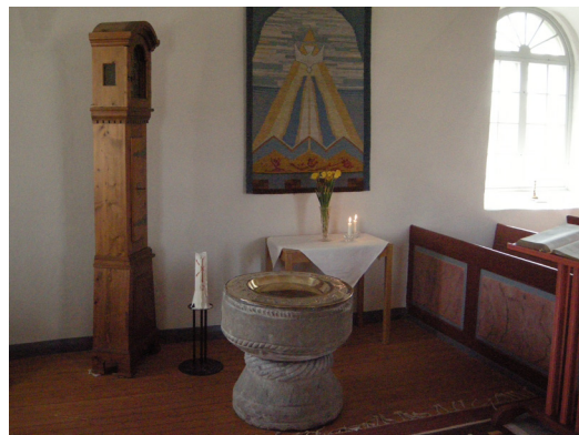
Dopfund och golvur