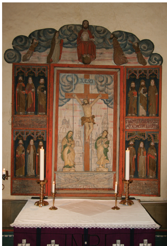
Altarskåp från 1400-talet

Den övre scenen är mycket skadad och därför svår att tolka. Möjligen kan det vara fråga om en motsvarighet till Frambärandet, nämligen Samuels överlämnande till templet (1 Sam. 1: 24-28)