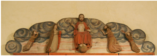
Ur altarskåpet, tillverkat under 1400-talet, det ovanliga motivet "den dubbla förbönen".