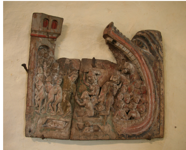
Trärelief föreställande Yttersta domen

En trärelief från 1400-talet, föreställande Yttersta domen finns på korets nordvägg. Denna relief, där man ser de döda stiga upp ur sina gravar, kan ha varit en del av en större framställning.