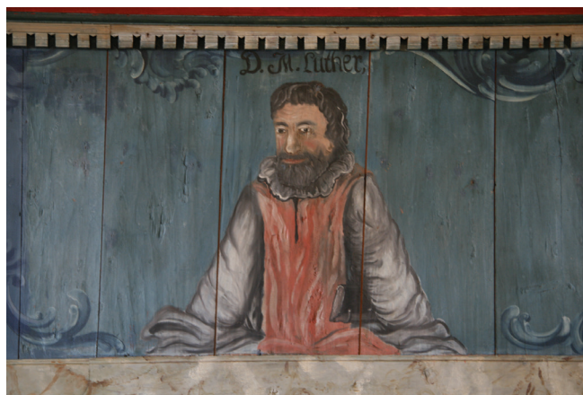
Orgelläktaren från 1741 - målningen föreställer en leende Martin Luther.