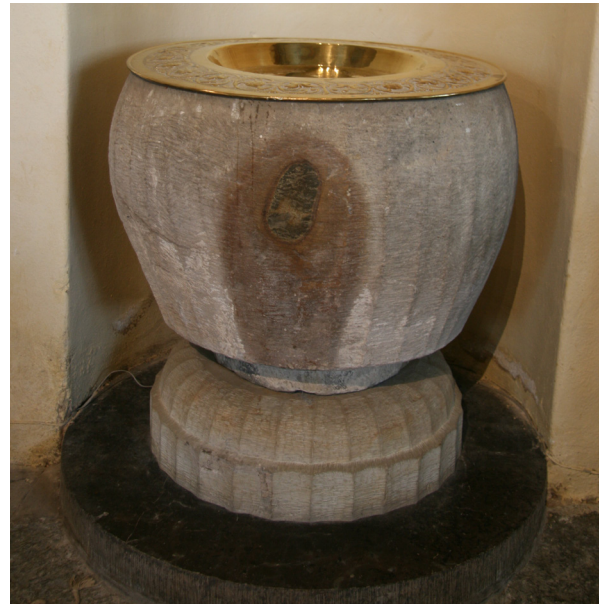
Dopfunten från medeltiden

Ett romanskt träkrucifix från 1100-talet finns idag på Borås museum tillsammans med en gammal kyrkdörr samt straffstocken.