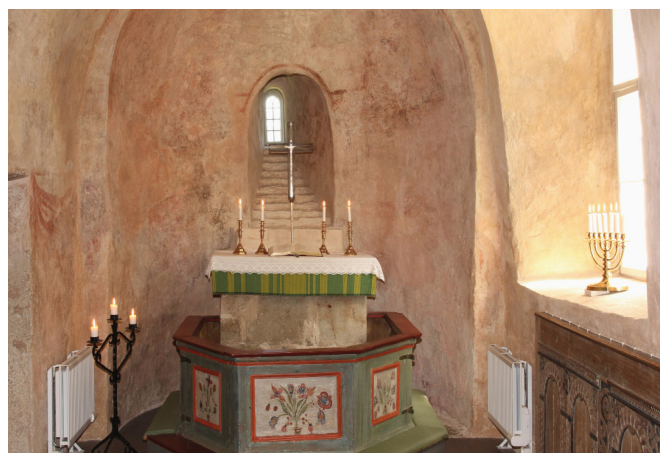
Altaret med himlatrappan

Predikstolen anses vara den äldsta bevarade i Sverige och är signerad J.A.J. 1574. I kyrkan finns en mässkrud från 1600-talet. Kyrkans nattvardskalk är av förgyllt silver från 1619.