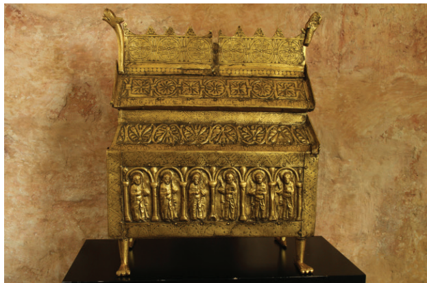
Kopia av relikskrinet

”Eriksbergsskrinet är utformat som en kyrkobyggnad, närmast en stavkyrka, krönt av ornerad takkam med lejonhuvud på nockarna. Dessa huvuden, liksom de djurfötter på vilka skrinet vilar, är gjutna medan relieferna för övrigt är drivna och grave-rade” (L. Karlsson). Originalet förvaras på Statens historiska museum.