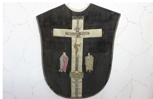
Mässkrud från 1600-talet

Kyrkan har två vapenhus, det södra timrade är från 1600-talets första hälft och det murade västra vapenhuset sannolikt från 1740-talet. Bänkinredningen är från 1932.