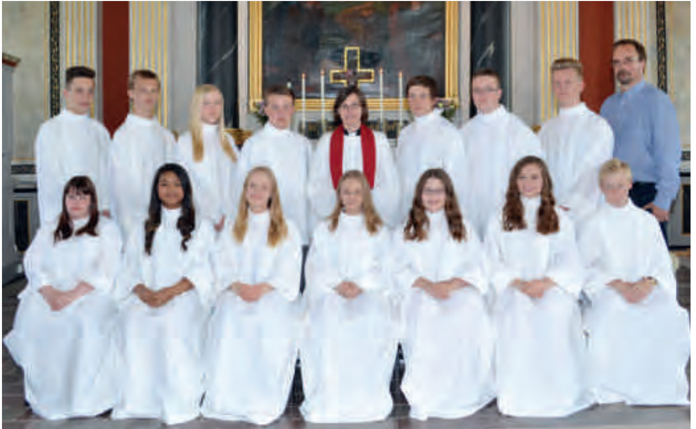
Konfirmation 17 maj.