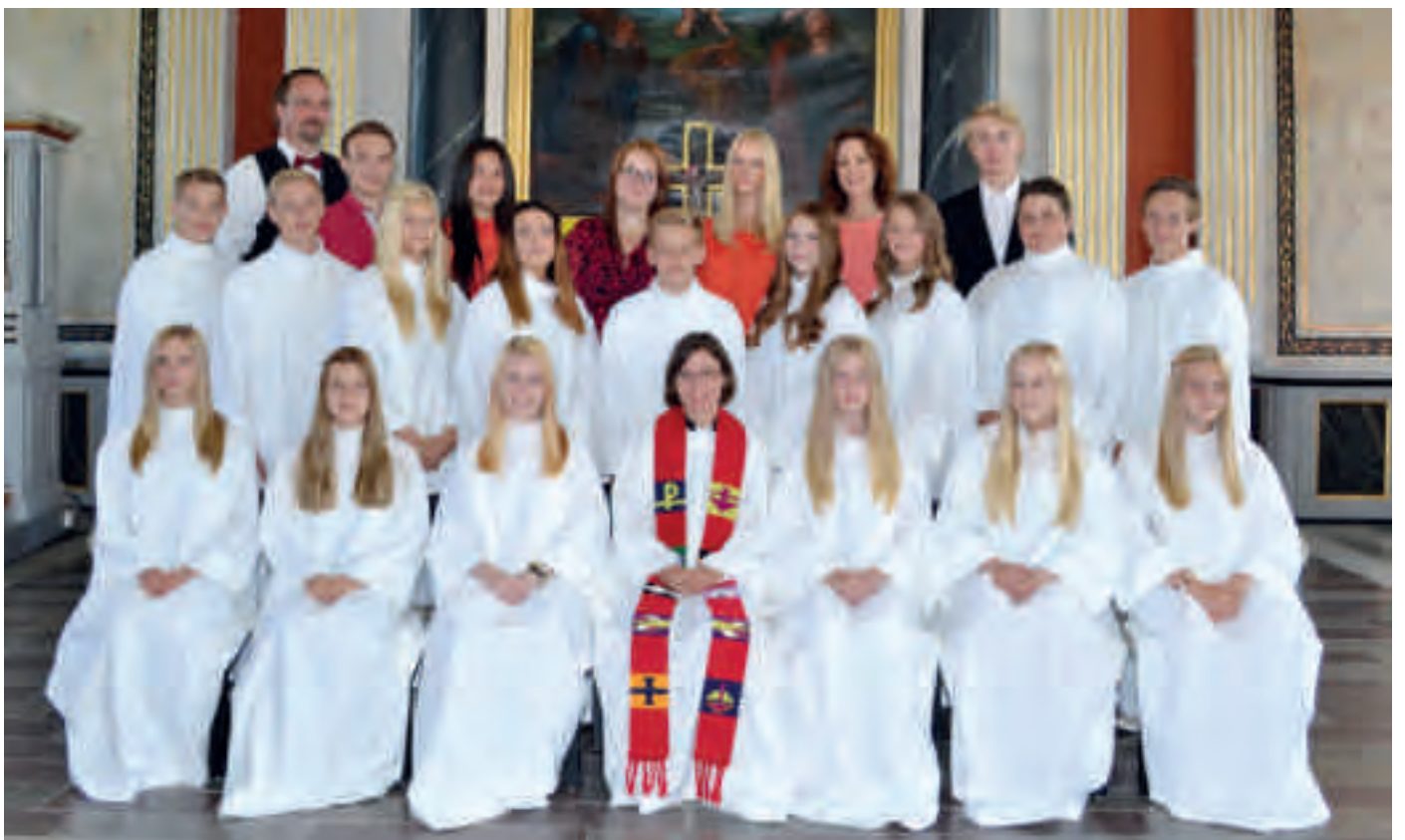
Konfirmation 5 juli.