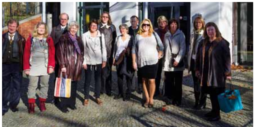
Glada körsångare från Storvreta/Ärentuna under körresan till Berlin förra året.

Kören har ett tjugotal sångare och arbetar med en bred repertoar med alltifrån äldre till nutida musik. I höstas gjorde kören en körresa till Berlin, där man bl sjöng i Svenska kyrkan.