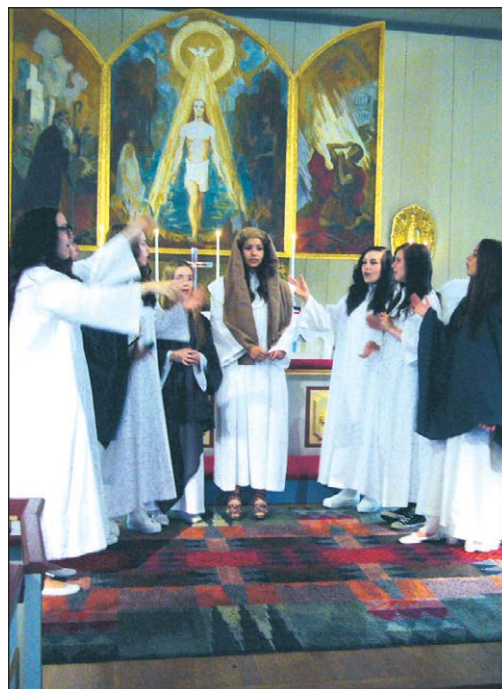
Lesjöforsgruppens konfirmation i Rämöns kyrka.

Ungdomsgruppen "Ferlinarna" åkte till Stockholm medan "assistenterna" – både små och stora medhjälpare i verksamheten – bokstavligen gick i kloster. En intressant och spännande tur till Varnhem utanför Skövde blev deras final på året som gått.