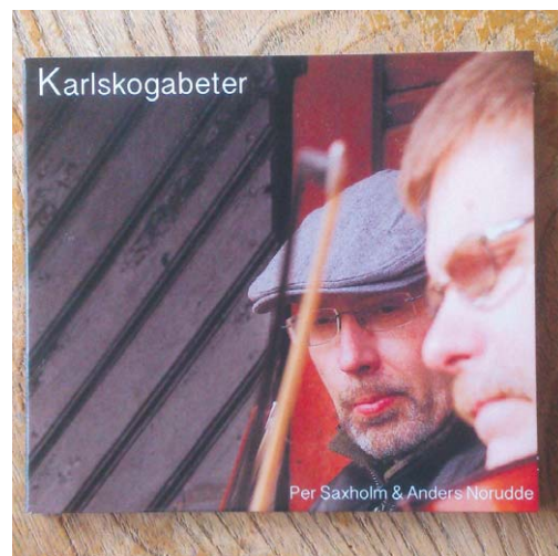
Saxholm och Norudde – spelemän som plattat till sig.