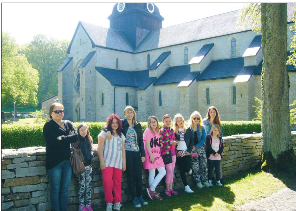
Hela gänget som besökte Varnhems kloster.