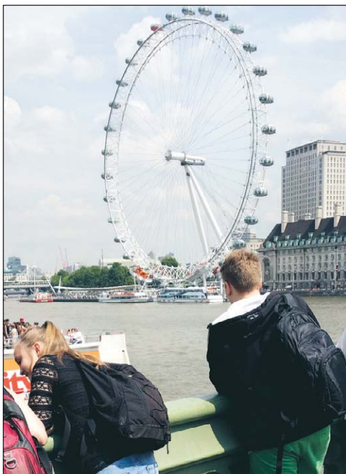
Populärt besöksmål i London – The London Eye.

Sju deltagare bland konfirmanderna, den så kallade "Londongruppen", gjorde en resa till den engelska huvudstaden med besök på en rad olika och kända platser.