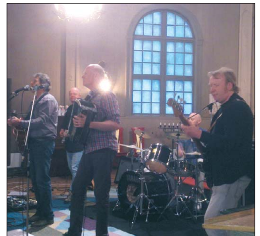
Patrasket spelade för nästintill fullsatt kyrka på "hemmaplan" i Nordmark.