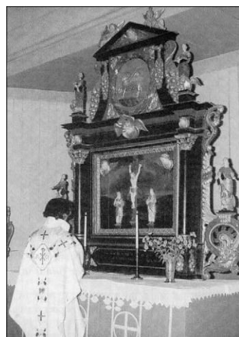
Altartavlan i Brattfors kyrka.