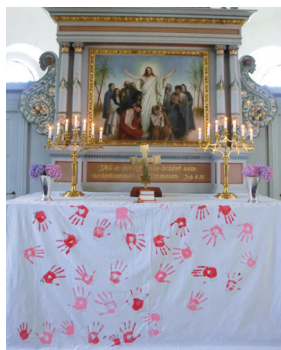
Antependiet med alla händer!