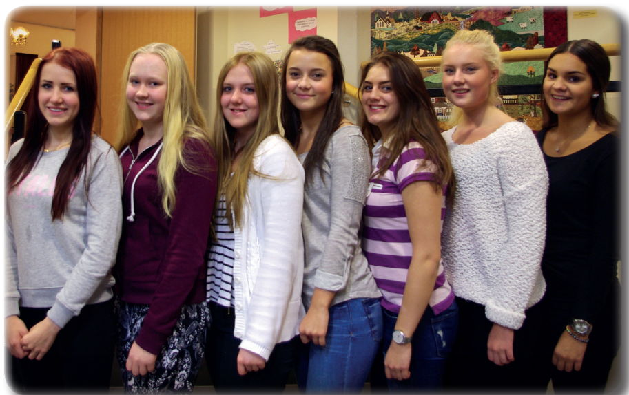
De nominerade Luciakandidaterna som du kan rösta på.