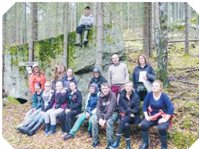
Skönt att vila en stund