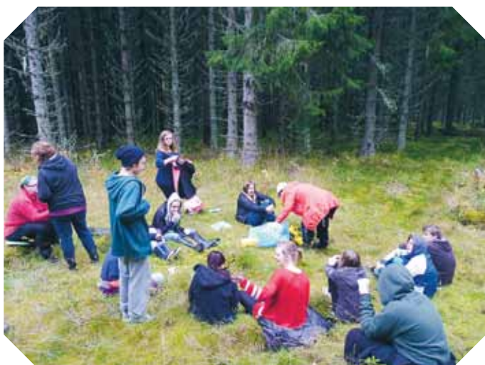
Saft och bullar smakade bra när vi kommit fram