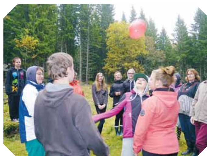
Lite lekar innan hemfärden