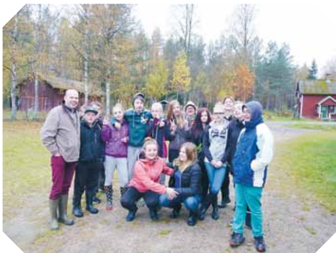
Konfirmanderna klara för vandring till Dysselberg