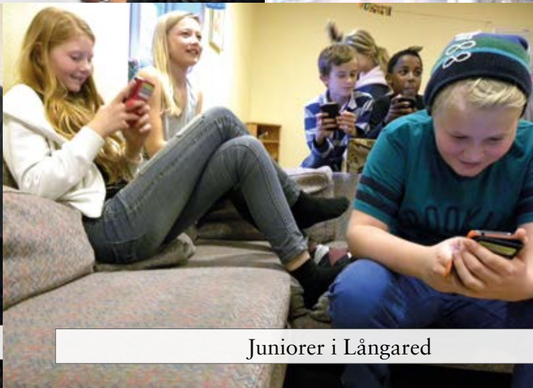
Juniorer i Långared