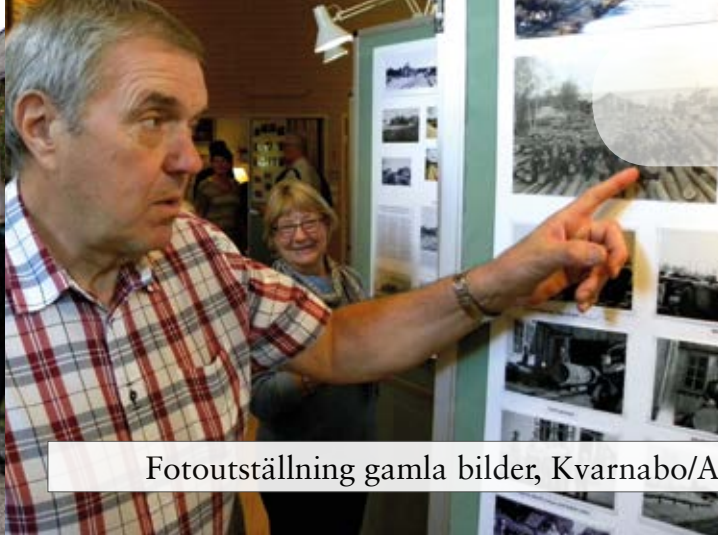
Fotoutställning gamla bilder, Kvarnabo/Anten