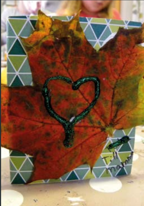
Minior till sin mamma, Stora Mellby.