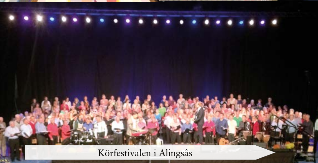
Körfestivalen i Alingsås