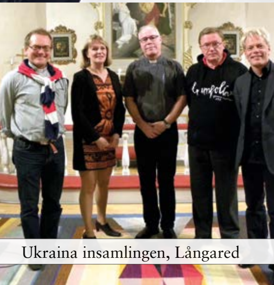
Ukraina insamlingen, Långared