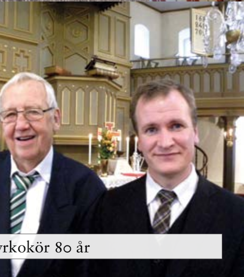
Chörkör 80 år