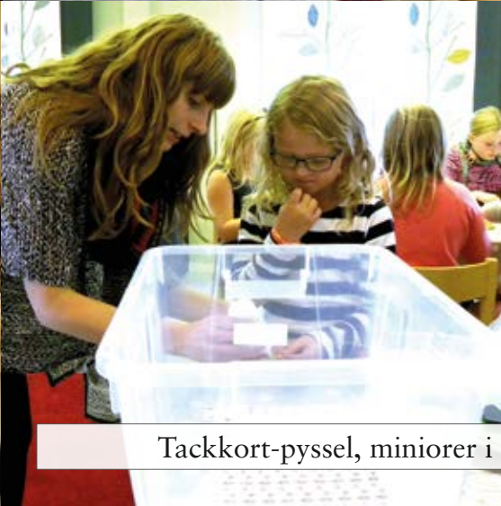
Tackkort-pysel, miniorer i Stora Mellby