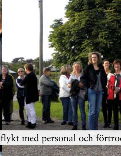
Utflykt med personal och förtro