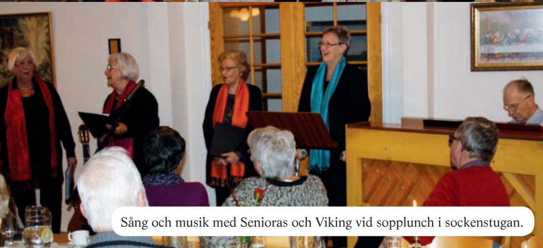
Sång och musik med Senioras och Viking vid sopplunch i sockenstugan.