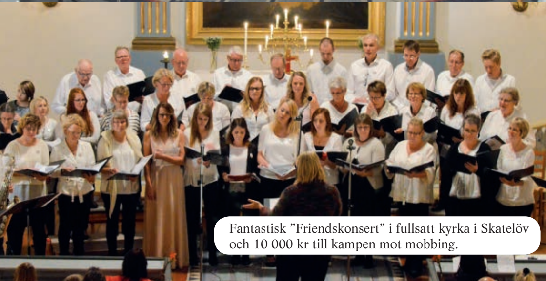
Fantastisk "Friendskonsert" i fullsatt kyrka i Skatelöv och 10 000 kr till kampen mot mobbing.