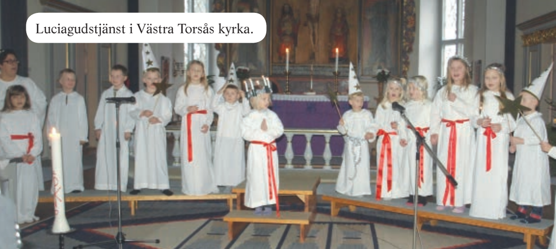
Luciagudstjänst i Västra Torsås kyrka.