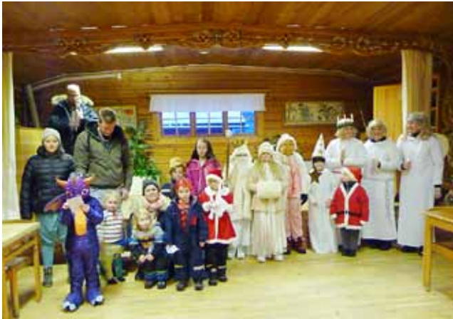
Pristagarna på knutdansen