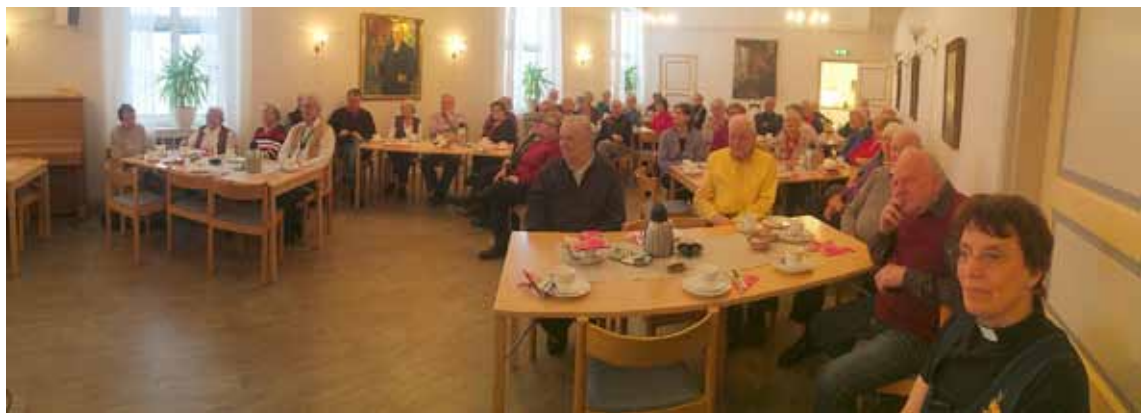
11-kaffe 29 januari