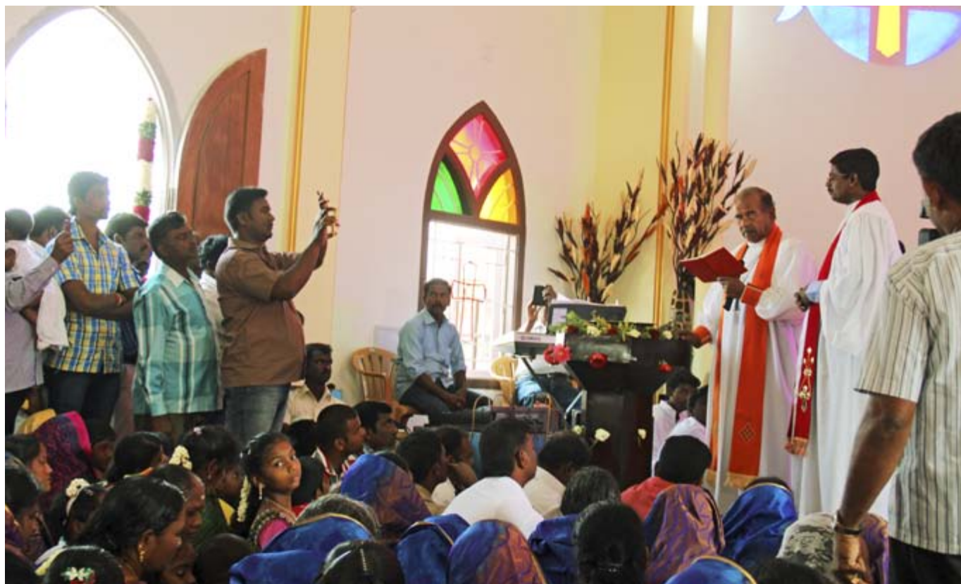
Efter sex år är bygget av kyrkan färdigt och kyrkan invigdes vid vårt besök.

Vi fortsatte färden söderut till Madurai. Där kom vi att bo i ett gästhus på TTS, Tamil Nadu Theological Centre. TTS som tidigare var missionsstation, är idag platsen för en fyraårig prästutbildning. För oss var