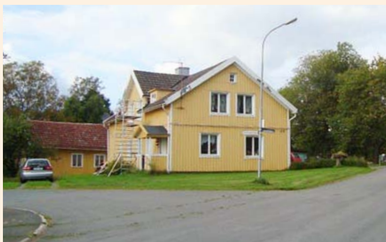
Villa Björkedal blev Nils von Kantzows sista bostad, först några år som byresgäst och sedan som ägare av fastigheten från 1958 fram till sin död 1967.