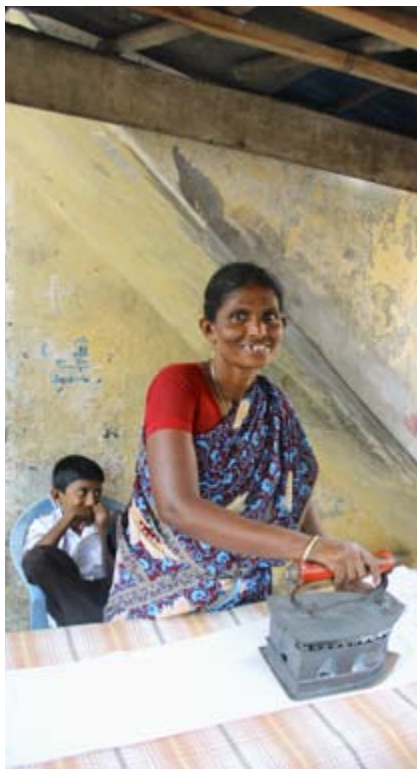
Kvinna i slummen som stryker. Strykjärnet värms med glödande kol.