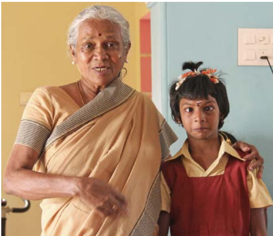
Grundaren och föreståndaren för dagcenter Shalom Centre tillsammans med en av ungdomarna.

det extra intressant att besöka TTS eftersom ett av Mullsjö-Sandhems församlings insamlingsprojekt just nu är stöd till TTS.