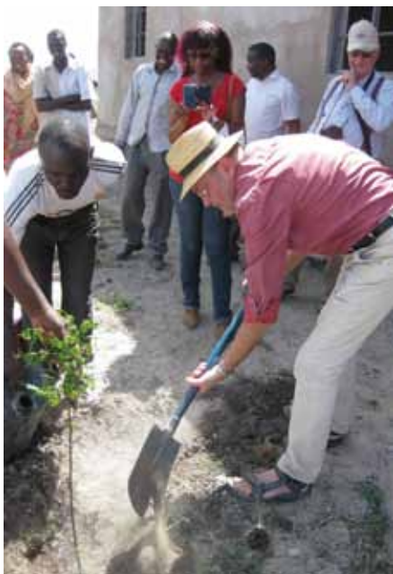
Trädplantering vid den nya ekumeniska kyrkan.

Planer finns på att starta sjukhus inom en snar framtid.