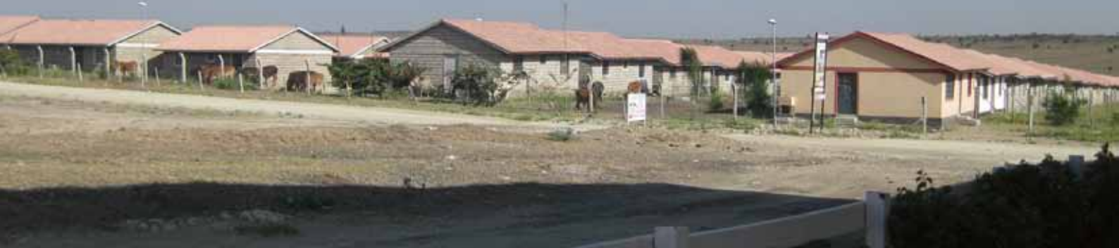
S.k. low-costing houses, som byggts upp med hjälp från Jamii Bora och egna arbetsinsatser.