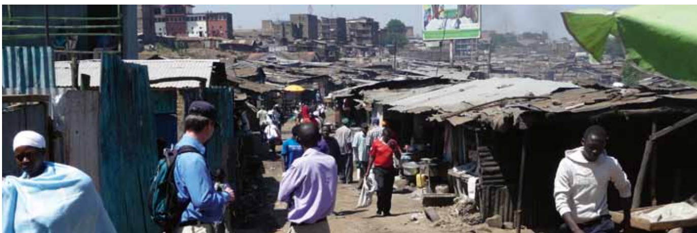
Oändliga käckstäder breder ut sig.

Text Ulf Wallner