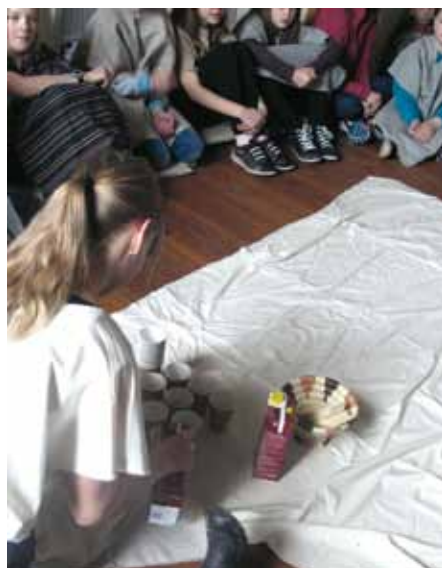
Den första nattvarden.