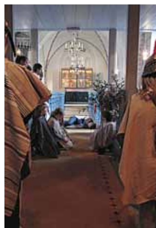
Trötta lärjungar somnar i Getsemane.