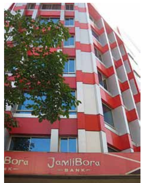
Jamii Bora Bank

För att ge möjlighet att skaffa sig ett annat boende har Jamii Bora köpt ett stort markområde av massajerna och i egen regi börjat bygga bostadshus i Kaputei sex mil söder om Nairobi. Det är s k ”low-costing houses”, enkla bostäder som byggs upp med arbetsinsatser av medlemmar som får arbete och som får låna i banken till husen.