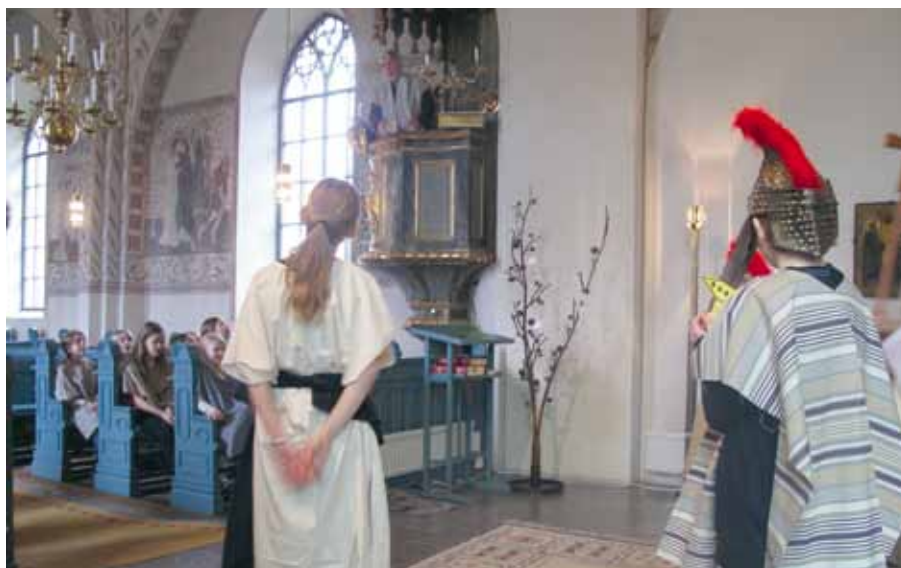
Jesus inför Pilatus.