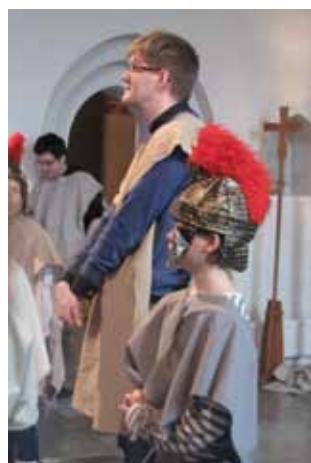
Barabbas, omgiven av soldater släpps fri i stället för Jesus.