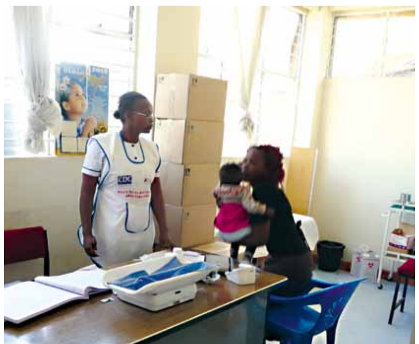
Huruma hälsoklinik hjälper människor med det nödvändigaste.