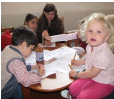
Barnen i söndagsskolan i Fuxerna kyrka får höra bibelberättelser, rita och pyssla.