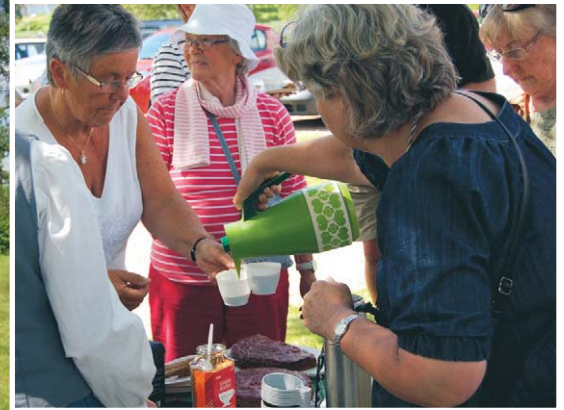
Rämmendagarna har blivit ett populärt inslag i bygden om somrarna och med alltfler besökare.