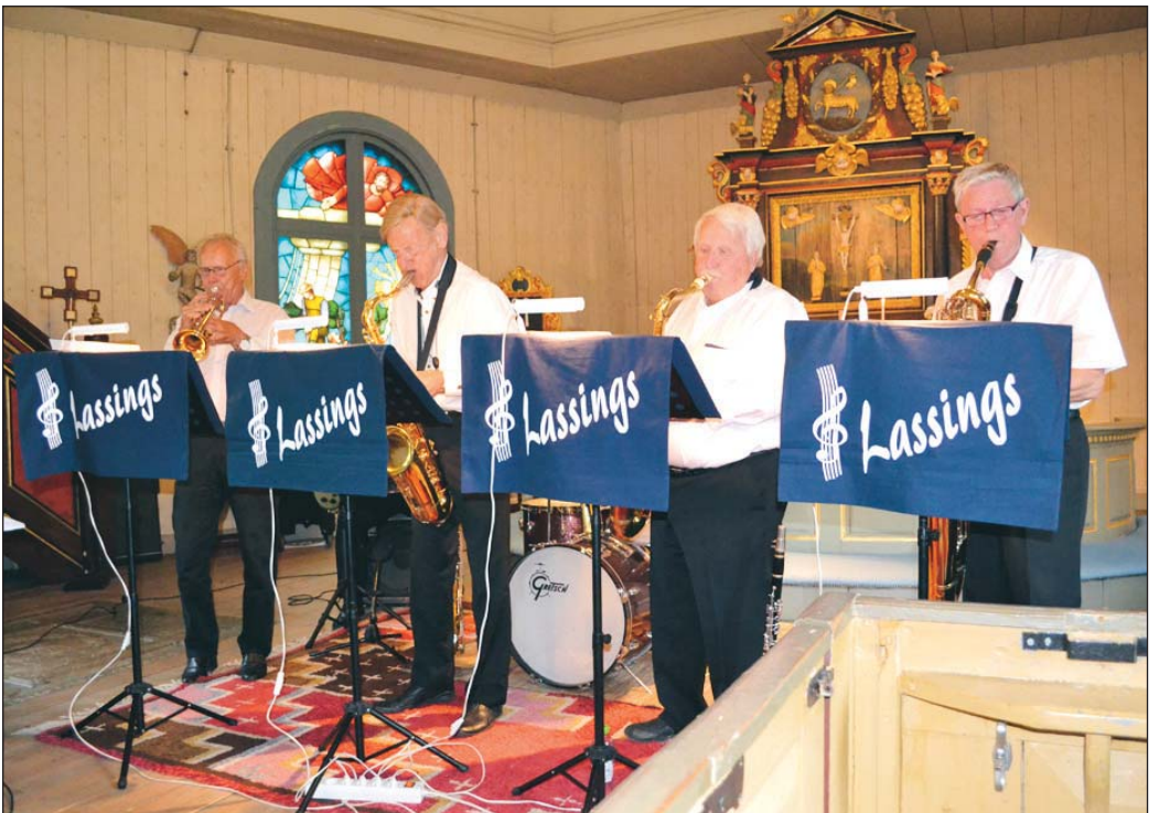
Rutinerade Lassings lockade många till Brattfors kyrka.