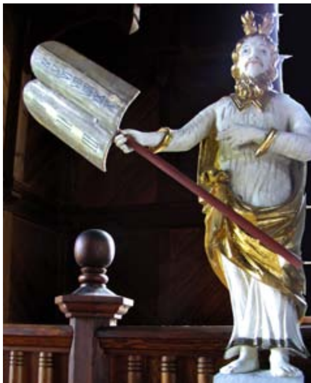
Mose och tavlorna med budorden i Bjurbäcks kyrka.

Du skall inte missbruka Herrens, din Guds, namn, ty Herren skall inte låta den bli ostraffad, som missbrukar hans namn.