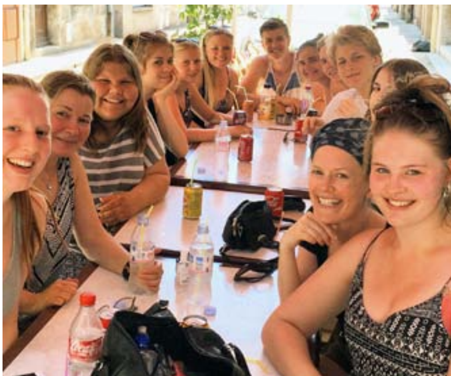
Här är hela glada gäng-et som reste till Taizé samlat.

8.15 börjar kyrkklockorna åter ringa. Den här gången för att alla komunitetens besökare och bröder ska ta sig till den stora och otroligt vackra kyrkan! Efter tio minuters ringande sitter vi idag tillsammans med ca 1500 andra personer, otroligt maffigt! Vi sjunger de fina Taizé-sångerna, som är speciella på så sätt att man sjunger korta rader om och om igen, på flera olika språk! Bröderna läser bibeltexter och ber böner, även detta på olika språk! Den en timma långa morgonbönen som även innehåller tio minuters tystnad avslutas med nattvard och efter det springer vi till frukostkön! I år har jag turen att vara gruppleddare för en bibelstudiegrupp för 15-16-åringar vilket betyder att jag får gå i en annan frukostkö och får min frukost snabbare! Frukosten är speciell men