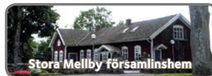
Stora Mellby församlingshem

IDEN MÅN DET FINNS, ANVÄNDER VI EKOLOGISKA RÅVAROR VI ANVÄNDER ALLTID SVENSKA KÖTT- OCH KYCKLINGPRODUKTER I VÅRA SOPPOR.