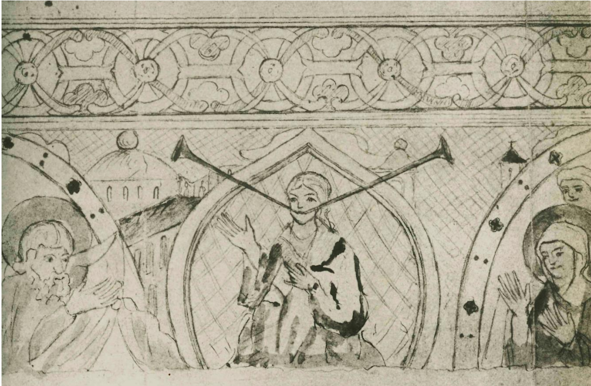
Bild 4: detalj från bild 3, norra muren. Figuren i mitten är tecknad som en kvinna med halsband och klänning, men det torde vara en missuppfattning av Nyström. Originalmålningen avbildade säkerligen en tronande Kristus inramad av en mandorla. Ur Kristi mun sticker ut två trumpeter, men Borelius förmodar att det på originalmålningen ska ha varit ett svärd och en lilja. Det är alltså ett Domedagsmotiv som till sin utformning har en parallell i exempelvis Järstad kyrkas valv.

Målningarna är idag endast åtkomliga från murkrönen och endast de allra översta delarna är synliga. Resten får man förmoda är förstört. Vid en invändig renovering 1966 undersöktes förekomsten av bevarade kalkmålningar. Fragment av medeltida puts befanns vara bevarade i kor och absid samt i fönstersmygen till ett igensatt fönster högt upp på sydväggen. Färgspår av målningar hittades endast i absiden (Löfgren Ek 2005).