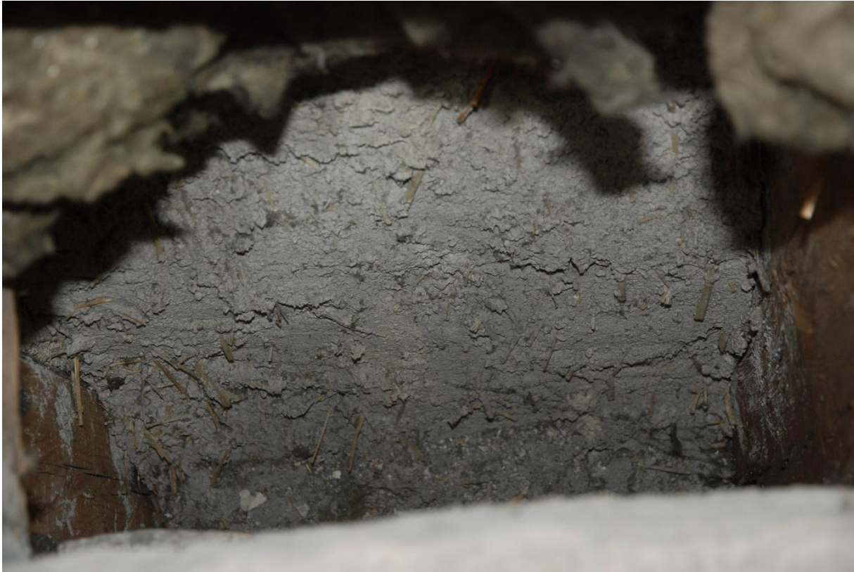
Bild 12: ovansidan av 1875 års tunnvalv, puts med armering av halm.

Rapport sammanställd av Gunnar Nordanskog 2014-07-16. Granskad av Eva Ringborg