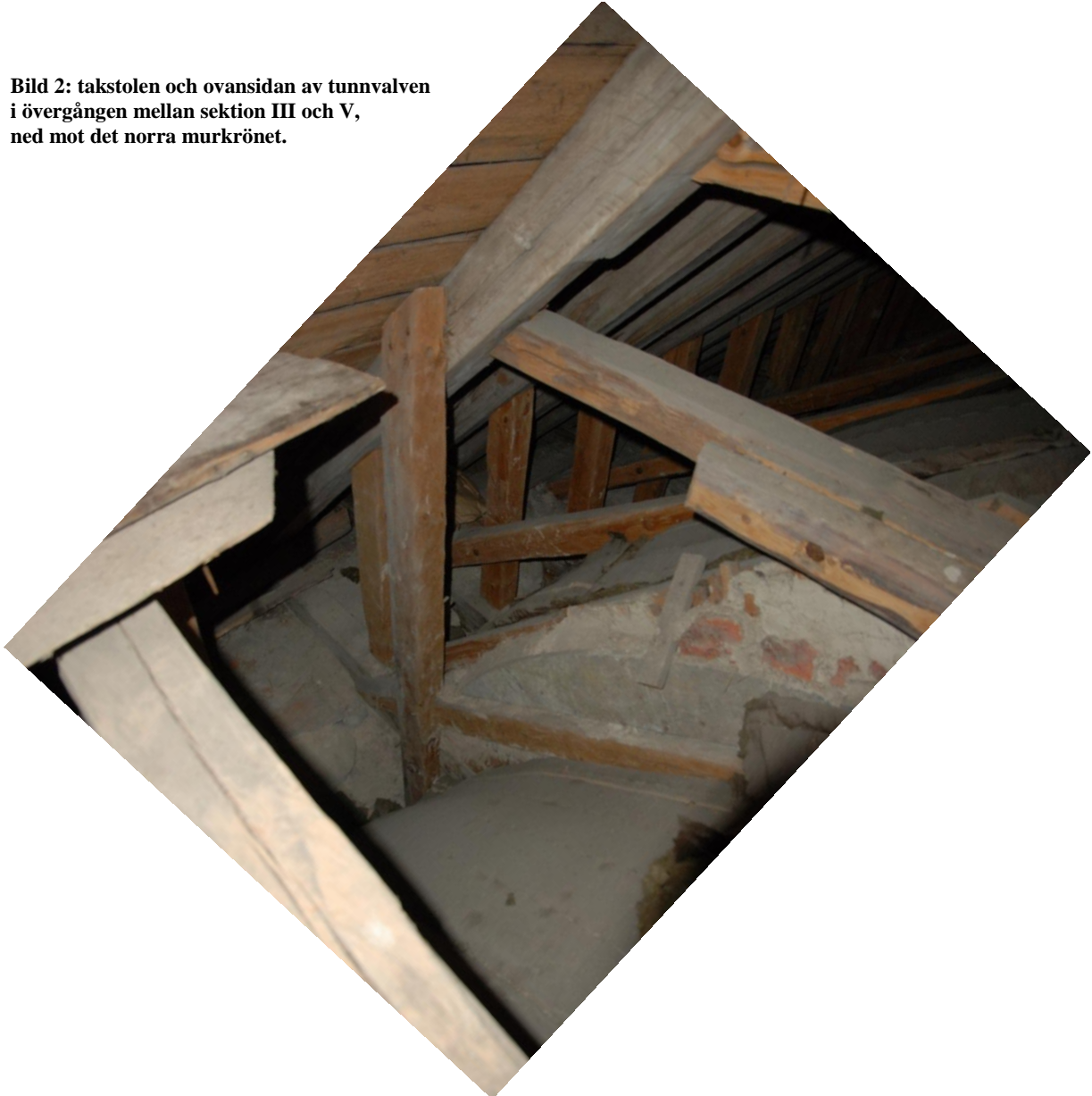
Bild 2: takstolen och ovasidan av tunnvalven i övergången mellan sektion III och V, ned mot det norra murkrönet.

Åtgärd: Ingen åtgärd föreslås, men vid varje arbete på kyrkans tak eller vind måste antikvarie kontaktas och stor försiktighet iakttas för att inte skada måleriet eller de medeltida delarna av takstolen.