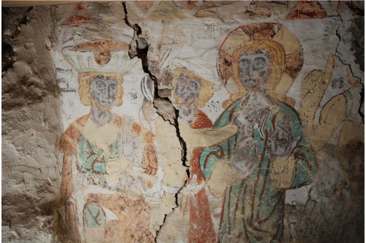
Bild 1: 1300-talsmålning över långhusvalvet, norra sidan: Kristus inför Pilatus. Den genomgående sprickan finns dokumenterad från 1956 och tycks inte ha rört sig.