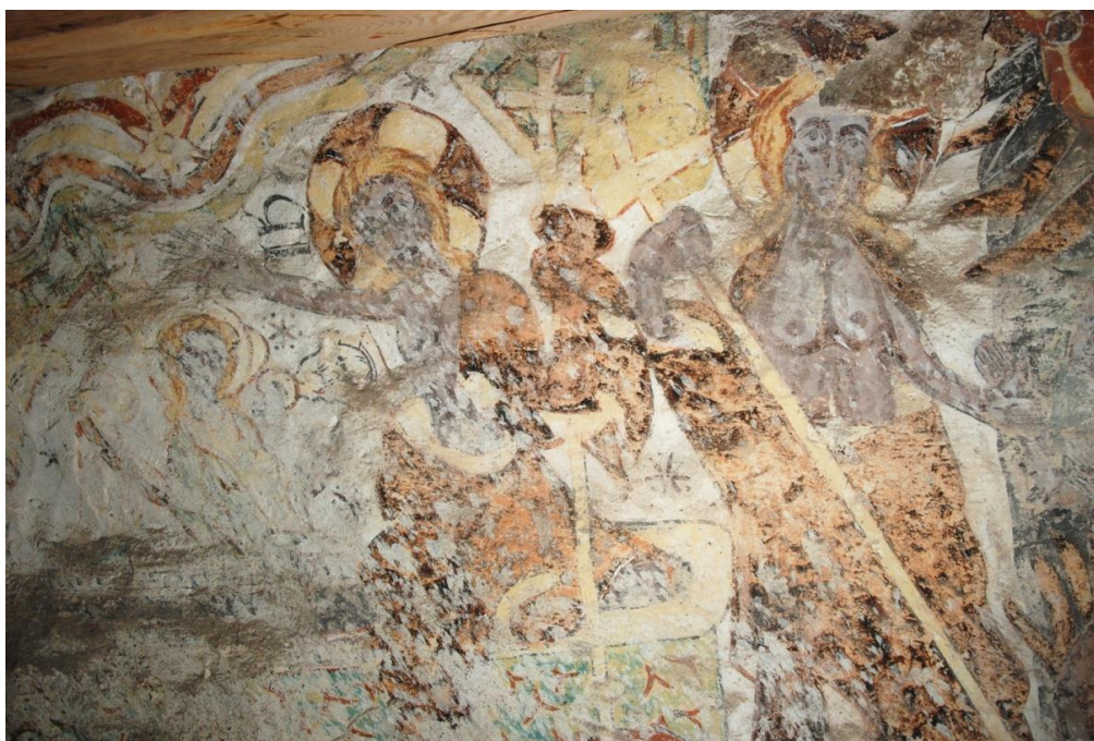
Bild 8: 1300-talsmålning över långhusvalvet, södra sidan. Till vänster: Kristi uppståndelse, till höger: Kristi nedstigande i dödsriket