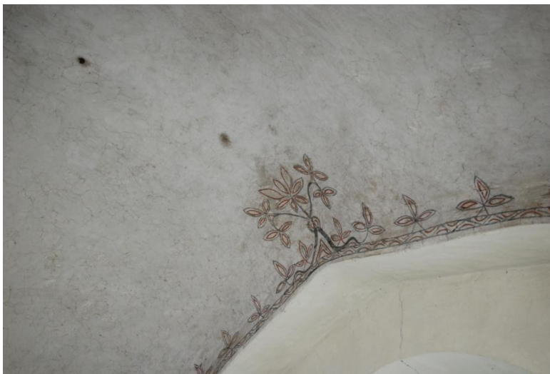
Bild 9: mögelfläck (?) strax ovan dekoren i norra korsarmens fönster. Den svarta fläcken längre till vänster i bild är en igensatt genomföring i valvet.

Valv och väggar är något smutsade, men ger ett behagligt intryck. I norra korsarmen (S:t Annas kor) har en liten provrengöringsruta gjorts ovan den östra läktaren. I valvet i samma kor finns en något märklig mögelliknande fläck en liten bit från fönstret (bild 9). Vidare har kalkputsen släppt på några ställen i långhuset, men teglet under är inte vittrat.