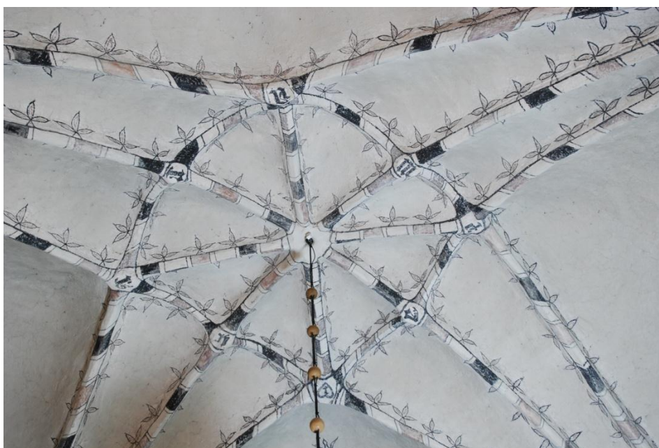
Bild 6: stjärnvalvet i det senmedeltida koret. Stenarna vid ribbornas skärningspunkter har försetts med varsin bokstav, tillsammans bildande inskriften "maria i xp", dvs Maria Jesus Kristus

Det finns också några yngre tillskott, dels i det medeltida koret, där det finns några texprader med en hänvisning till Jesaja kap. 40 och året 1592 (bild 7). I det nya koret är målat två korsade palmkvistar kring bokstäverna "H E S an A" en och året 173? (bild 8).