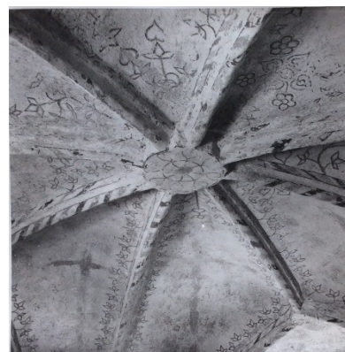
Det mellersta valvet är ett vackert utförmat stjärnvalv. T.v. nuläget, t.h. i samband med framtagningen 1948.