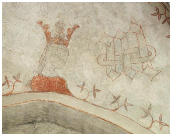
Korvalvet med avbildningar av Jesus, Laurentius, Andreas och Maria.