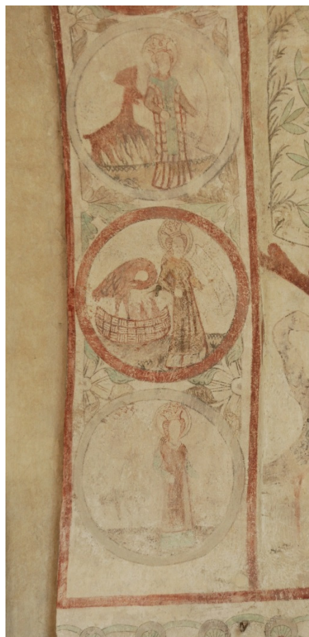
Bild 7-8: Triumfbågens norra sida, dygderna Ödmjukhet, Generositet, Kyskhet, Medmänsklighet, Måttfullhet, Tålamod och Flit. Det är något oklart i vilken ordning de är presenterade här, men dromedaren längst upp torde representera ödmjukheten.