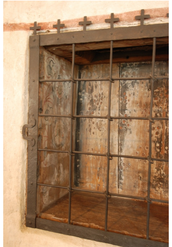
Bild 12: sakramentssskåpet i korets norra vägg, med bemålade bräder från det trätak som fanns före 1400-talets valvslagning.