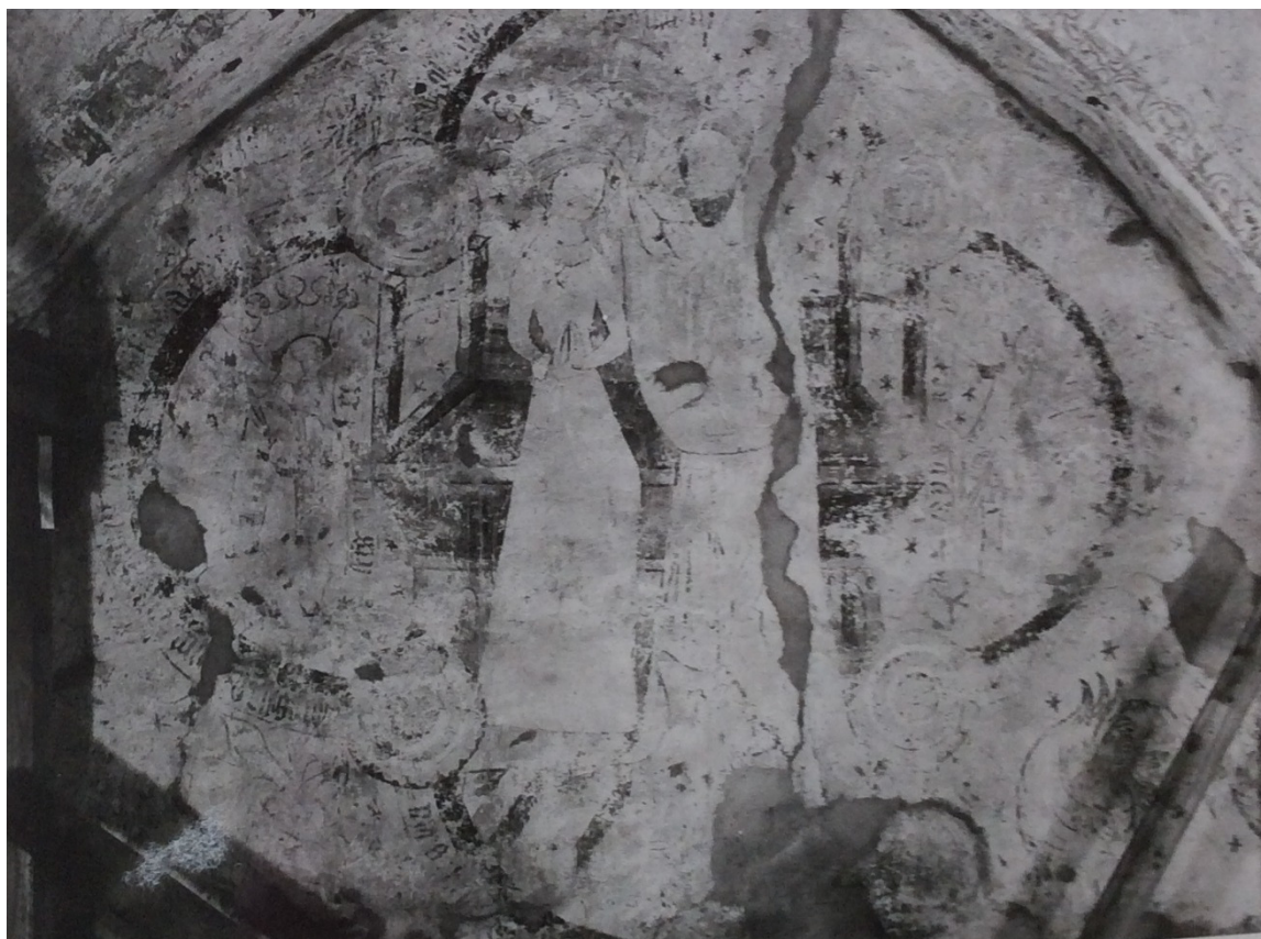
Bild 15: samma motiv som bild 14, före konserveringen. Foto ÖLM 1948.