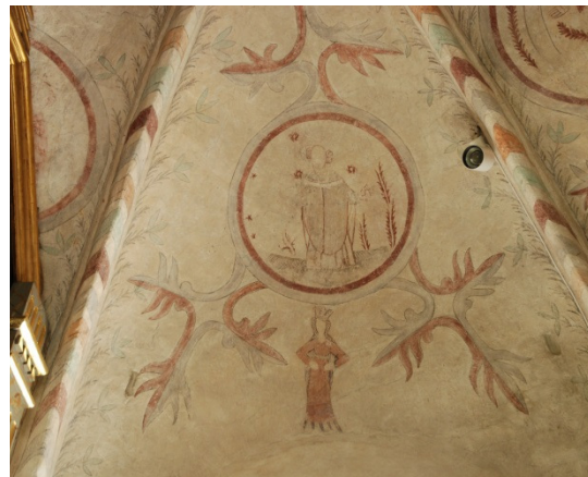
Bild 3-5: Korvalvet. Överst t.v. norra valvkappan med S:t Sigfrid, överst t.h. södra valvkappan med S:t Stefanus, och t.h. västra valvkappan med Skapelsen.