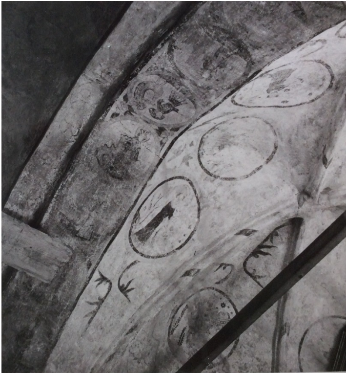
Bild 6: bild från 1948, före konservering. Från vänster syns triumfbågen, därefter korets västra och norra valvkappor