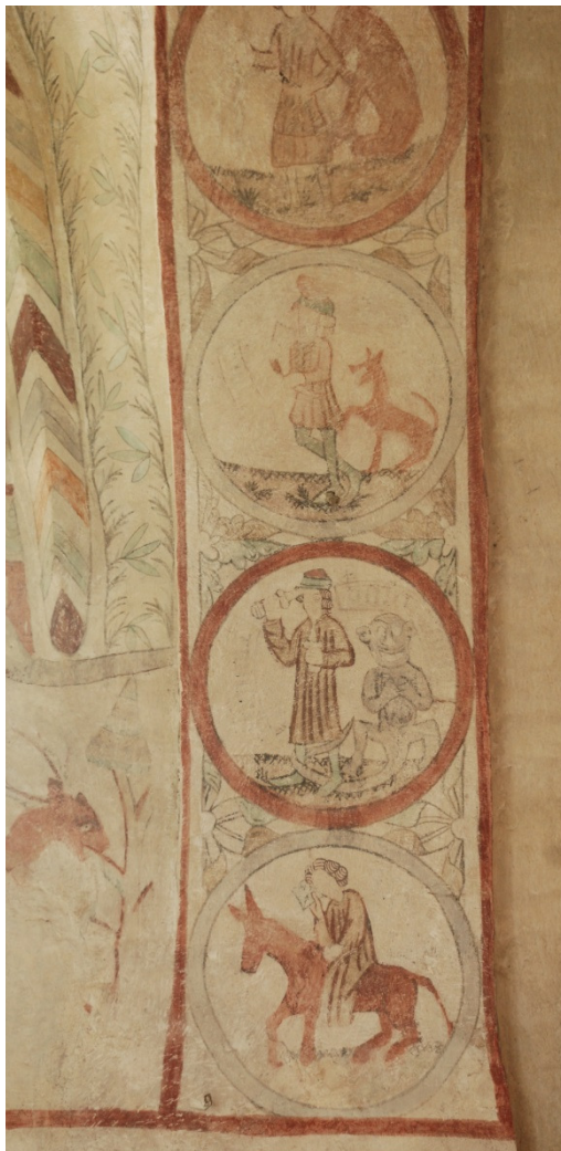
Bild 9-10: Triumfbågens södra sid, de sju lasterna eller dödssynderna, Högmö, Girighet, Lust, Avund, Frosseri, Vrede och Lättja. Den sistnämnda lasten syns nederst, gestaltad som en man ridande på en åsna samtidigt som han läser ur en bok.

Längst ned löper en draperimålning runt hela koret. En jämförelse mellan nuläget och bilderna från 1948 visar att det röda färgpigmentet har stått sig och är väldigt skarpt och tydligt i jämförelse med andra färger.