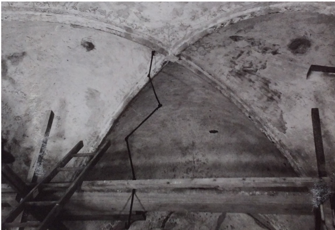
Bild 17: samma valv före konserveringen, mot norr. Foto ÖLM 1948.