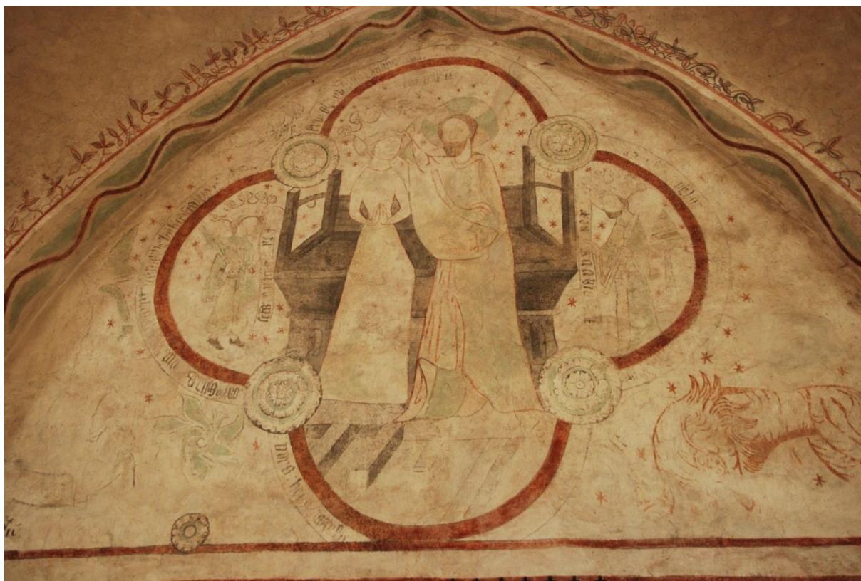
Bild 14: nordväggen ovanför sakramentsskåpet: Marie kröning. Nere t.h. ett lejon, och knappt urskiljbart nere t.v. ett lamm.