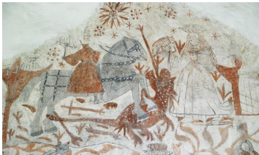
Korets nordvägg, överst. S:t Görän

På ko rets nordvägg avbildas överst S:t Görän och draken, samt prinsessan. Målningen följer i stort sett kanten efter det medeltida valvet. Därunder syns en människa omslingrad av ormar, Kristus på korset samt Lyckans hjul. I en understa rad syns Marie bebådelse, Marias och