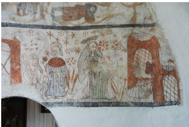
Korets nordvägg. T.v. nuläge, t.h. från framtagningen 1937.

Målningarna är ställvis kraftigt retuscherade och kompletterade. Nedsmutsningen är måttlig och färgskikten stabila, men putsen har sprickor och bortfall som behöver åtgärdas.