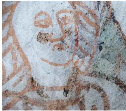
Korets nordvägg, exempel på skador. T.v. spricka, t.h. färgbortfall