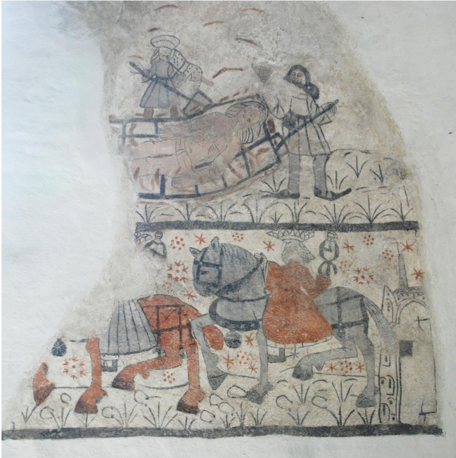
Korets sydvägg. Överst S:t Laurentius, nederst två kungar