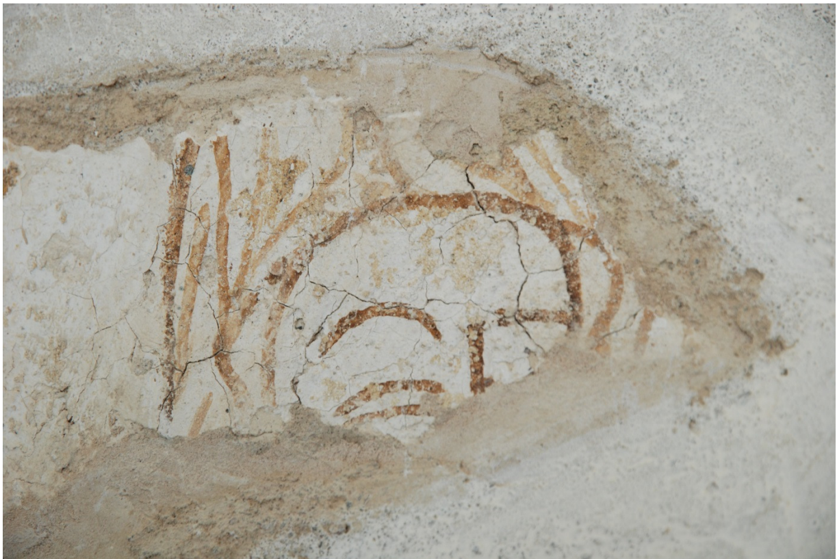
Bild 5: Kvinna med huvuddok, detalj av bild 3. Notera sprickbildningen.