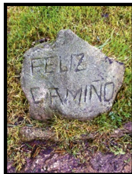
"Lycklig väg" på spanska: God tur! En försynt liten uppmuntran från vägkanten.