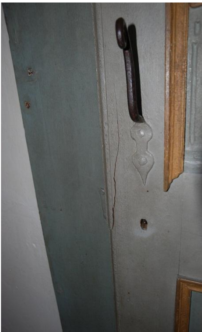
Bild 10: skada på predikstolsdörren, bör åtgärdas av konservator.

Rapport sammanställd av Gunnar Nordanskog 2014-06-17. Granskad av Eva Ringborg