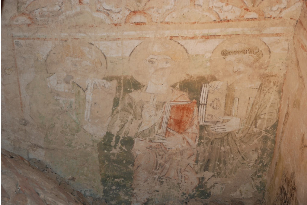
Bild 3: nordöstra långhusväggen ovan valv, tre munkar eller diakoner.