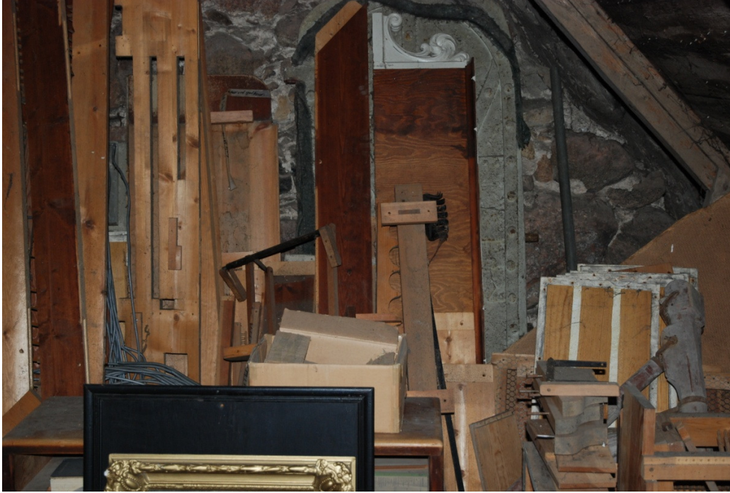
Bild 12: senmedeltida järndörr på vapenhusets vind (syns bakom träpanel med gråmålat ornament).

Rapport sammanställd av Gunnar Nordanskog 2014-04-21, revidering 2015-09-17 Granskad av Eva Ringborg