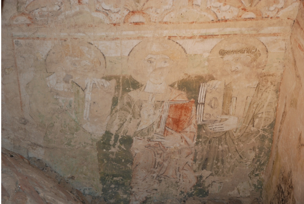
Bild 3: nordöstra långhusväggen ovan valv, tre munkar eller diakoner.

Måleriet i Kaga kyrka är väl dokumenterat och beskrivet, varför här endast görs en kort sammanfattning. För det romanska måleriet ovan valv hänvisas till Sten Petersons sammanställning från 2009 och konserveringsrapporter.