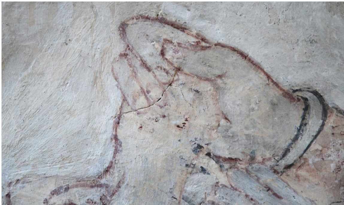
Bild 11: detalj av bilden ovan, Simsons hand med spricka i putsen