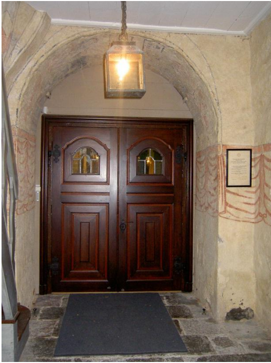
Bild 4: östra vapenhusväggen. I valvet motiv ur Jobs bok (se vidare nedan).

Tornet i Landeryds kyrka dateras till början av 1200-talet. I bottenvåningen, som fungerar som vapenhus, finns figurativa kalkmålningar daterade till 1600-talets början. Enligt icke verifierbara uppgifter ska målningarna ha bekostats av Claes Slatte år 1639. Stilistiskt liknar de målningarna i Vårdsbergs och Hägerstad kyrkor, vilka har tillskrivits Matz Målare. Dekormåleriet på valvribborna är sannolikt senmedeltida, medan draperimålningarna inte är möjliga att datera. Inga kalkmålningar är bevarade i andra delar av kyrkan.