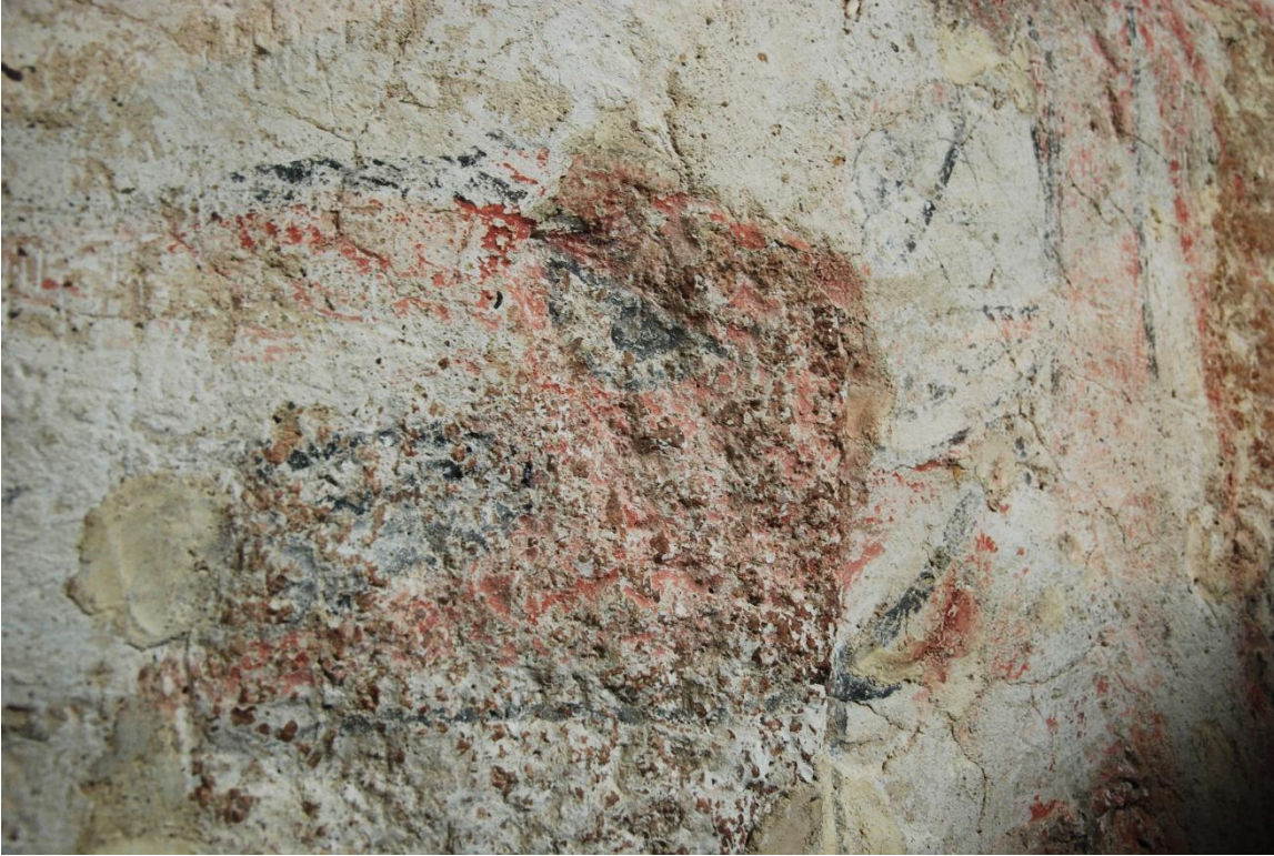
Bild 10: odjurs- (eller djävuls) huvud på nordmuren. Notera det gulartade lagningsbruket till vänster.