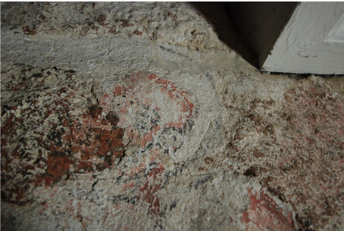
Bild 11: ansikte av ett helgon, med linjen efter glorian tydligt synlig.