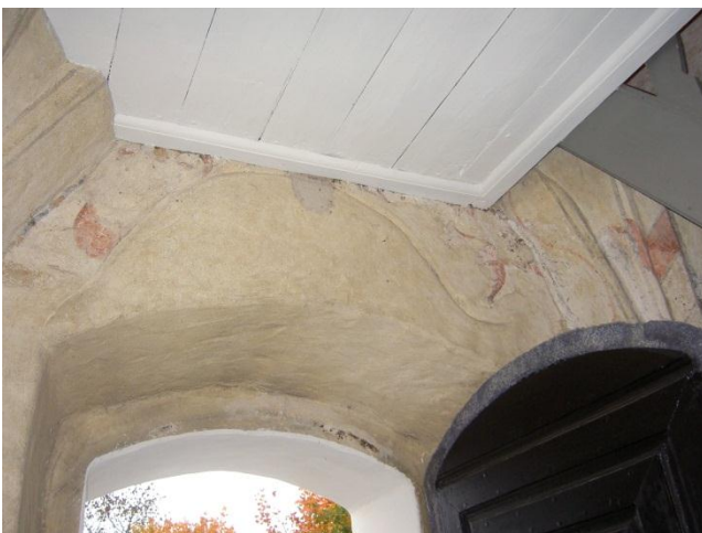
Bild 6: västra vapenhusväggen, ingången upptagen 1753. I valvet motiv ur Jobs bok (se vidare nedan).