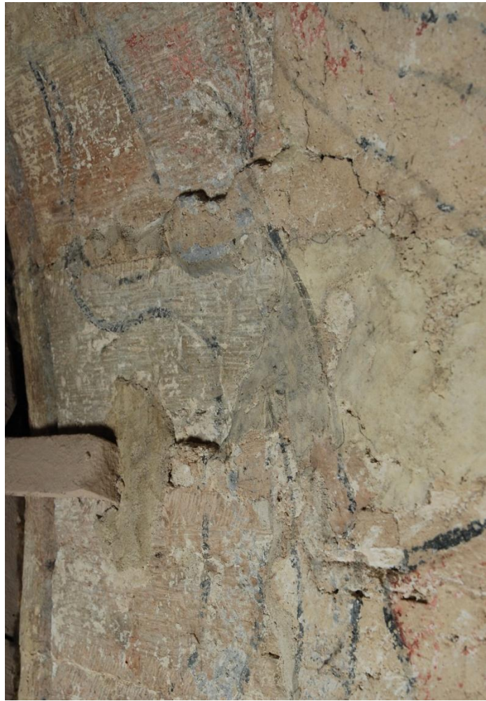
Bild 12: detalj av djävulen i valvet mot långhuset. Blandning av måleri på originalputs, lagningar och retuscherat måleri.

Kalkmåleriet har mekaniska skador, med bortfall i färg och putsskikt. Öppna sprickor förekommer.