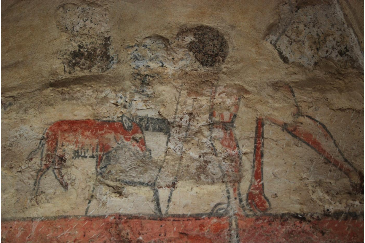
Bild 1: södra vapenhusväggen, detalj av motivet Den förlorade sonen.

Besiktning av kalkmåleri 2014-11-04 Gunnar Nordanskog & Eva Ringborg