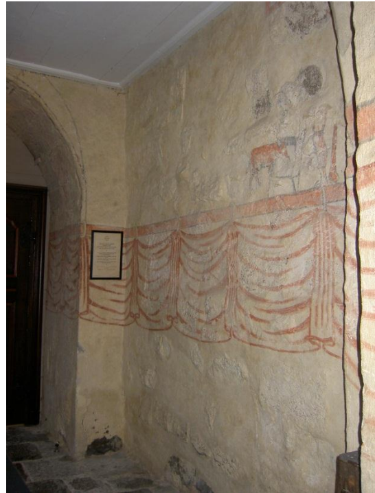
Bild 5: södra vapenhusväggen. Draperimålningar och liknelsen om den förlorade sonen.