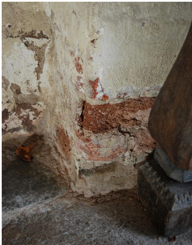
Bild 3: putsskador av markfukt, putssläpp och en söndervittrad tegelsten i sydvästra hörnet. Denna skada finns dokumenterad i VoU-plan från 2006, men nya skador finns i sydöstra hörnet. Teglet kan konsolideras och putsskadorna åtgärdas av konservator.