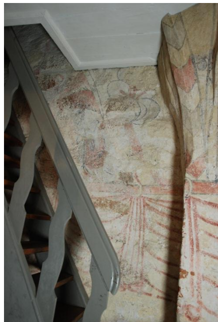
Bild 7: norra vapenhusväggen, trappa upp till tornet byggd 1917. Dekor- och figurativt måleri.