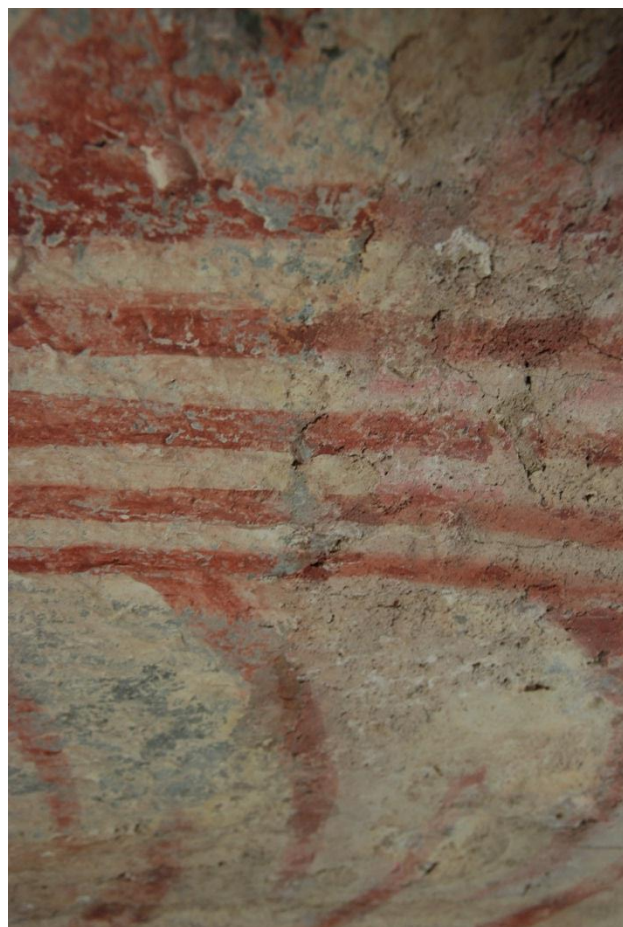
Bild 2: exempel på skada på draperimåleriet, sprickor och bortfall

Tidpunkt: vid nästa utvändiga renovering.