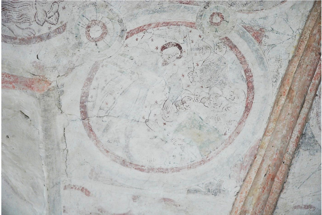
Bild 1 detalj från södra korsarmens valvmålning: Simson med åsnekäken.

Besiktning av kalkmåleri 2014-05-07 Gunnar Nordanskog & Eva Ringborg