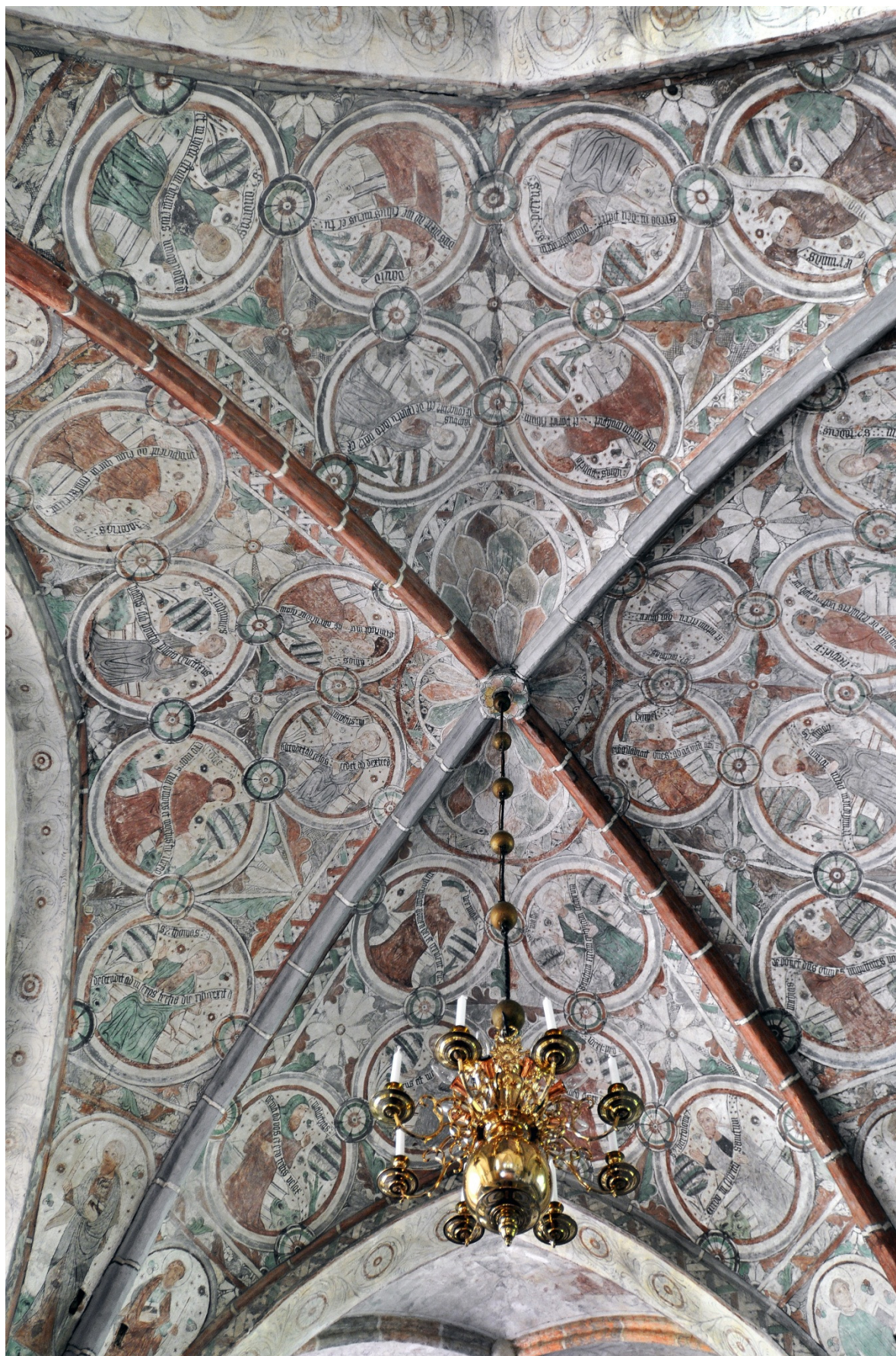
Bild 6: De kraftigt ifyllda målningarna i korsmitten som illustrerar den apostoliska trosbekännelsen. Foto Christer Elderud 2011.