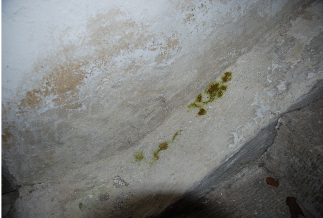
Bild 3: Exempel på fuktgenomslag och algpåväxt, södra sidan av invändig trappa i vapenhuset.