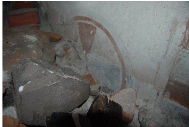
Ovan valven, södra långhusväggens fönster. Omfattningsmålningen är delvis rekonstruerad. T.h. detalj av korset i västra fönstersmygen, vilket är i originalskick.