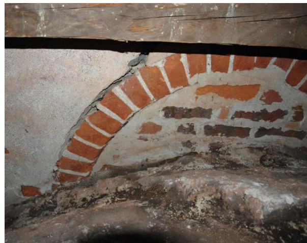
Ovan valven, östra korväggens fönster, utan bevarat måleri