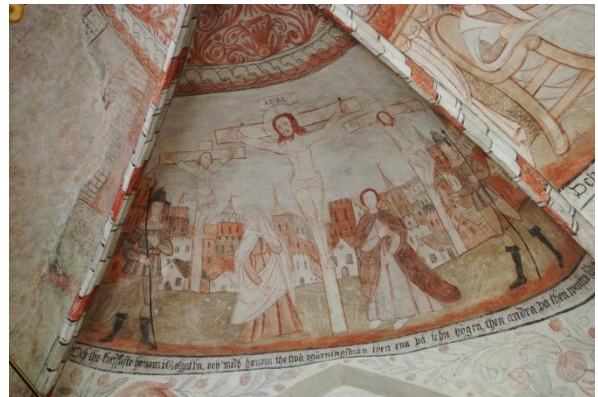
Korsfästelsen (norr). Text: "Och the korsfäste honom i Golgatha, och medh honom the twå ogärningsmän then ena på tehn högra, then andra på then wenstra sidan"