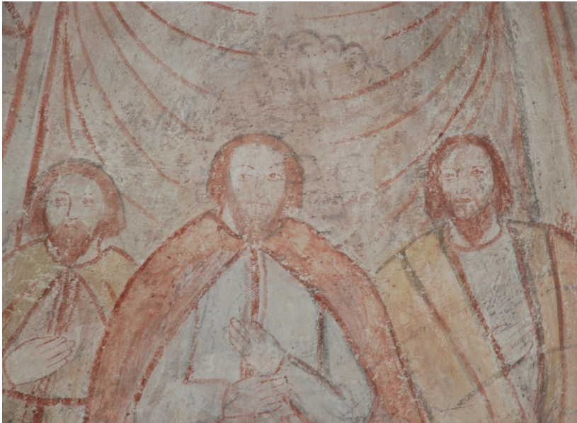
Detalj valv 2, norra kappan: under 1600-talsmåleriet skymtar ett ansikte (lejonhuvud) från senmedeltida måleri.