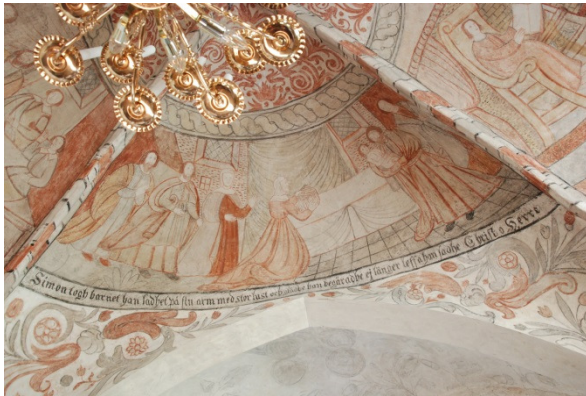
Simeons lovsång (öster). Text: "Simon togh barnet han ladhet på sin arm med stor lust och glädje han begäradhe ej länger leffa han sadhe Christ o Herre"

Långhusets valv är fyllda av 1600-talsmålningar som har varit överkalkade. De framtogs vid okänt tillfälle, "bättrades" av målarmästare Stillström 1888 och åtgärdades åter 1941-42 då mycket av 1888 års bättringar togs bort. Pigmentet i valvhjässornas figurativa måleri är mycket löst bundet. Språkbanden och dekorationerna kring valvens slutstenar och nedanförl språkbanden är i hög grad rekonstruerade och delvis avvikande från originalet. År 2010 genomfördes en rengöring upp till språkbanden samt en spricklagning i valv 3.