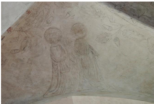
Marias och Elisabets möte (väster)