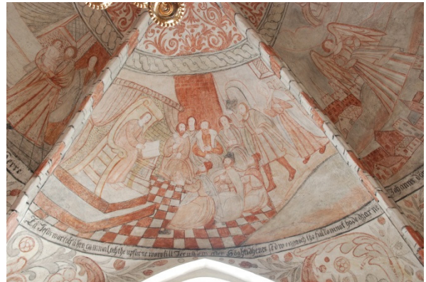
Jesus vid tolv års ålder (söder) Text: "Tå Jesus war tolf åhra gammal och the upfarne woro till Jerusalem efter Höghtidhenes sedro enga och the fulkomnat hade dgarne"