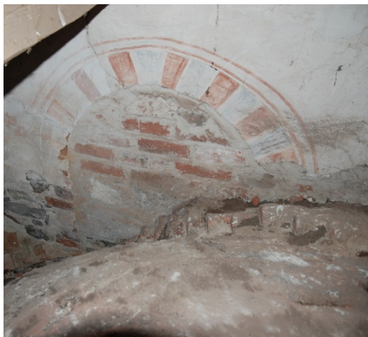
Ovan valven, södra korväggens fönster.