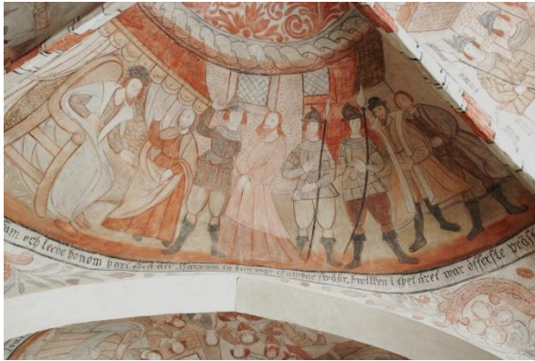
Jesus inför överstepräster (öster). Text: "Och the bundo Jesum och leede honom bort först till Hannam ty han war Caiphæ swäär, hwilken i thet året war öfferste präst."