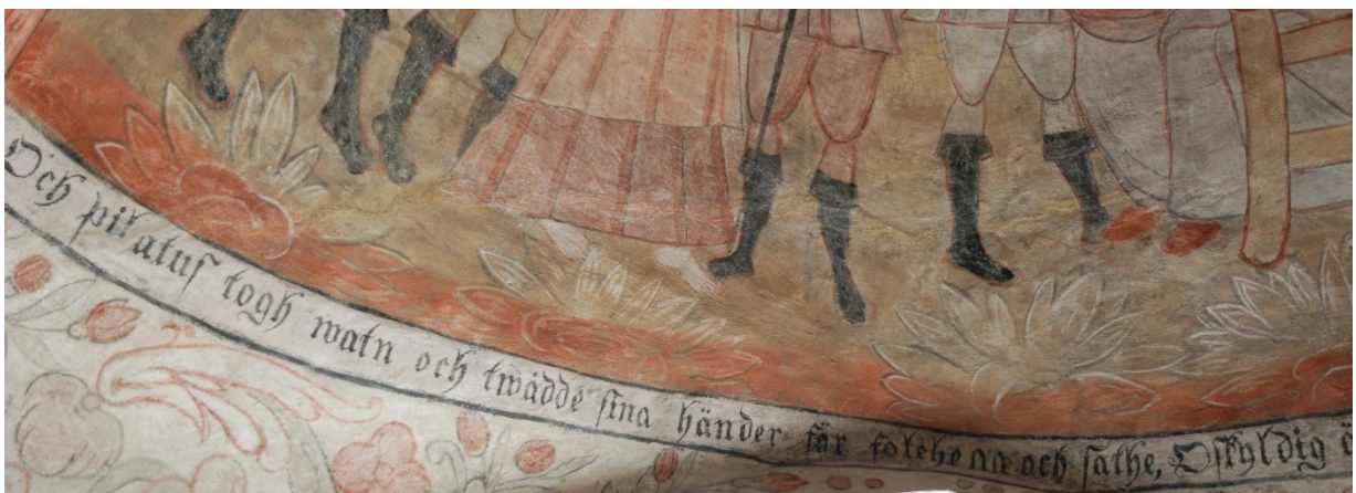
Detalj valv 4, södra kappan: de återkommande konturblommorna, vilka även förekommer i Landeryds kyrka.