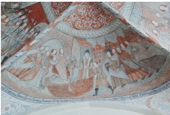
Jesu intåg i Jerusalem (öster). Text: "(...) till Dötterna Sion: Si tin konung kommer till dig sachtmodigh ridandes på en Åsninna och på en arbetes Åsninnos Fåle. Läriungarna gingo, och (...)”