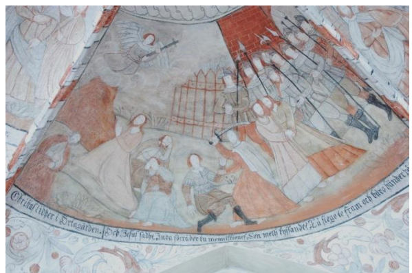
Getsemane (norr). Text: "Christus lidher i Örtagården. Och Jesus sadhe, Juda förråder tu människiones Son meth kyssande? Så stego te fram och bårö händer på honom”