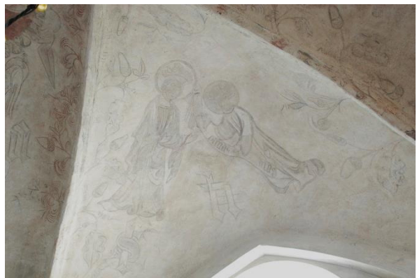
Marias bebådelse (söder)