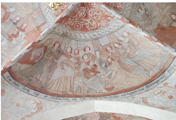
Jesus två lärjungarnas fötter (väster). Text: "Och Jesus stodh upp aff Nattvarden, och lätt watn i ett bäcken och begynte två Läriungarnas fötter”