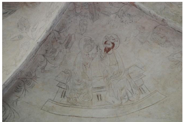
Marias kröning (norr)