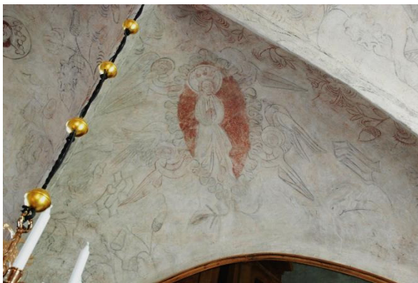
Maria i rosenkrans (öster)

Korets valv är av en typ som slogs i Östergötland från sent 1300-tal till ca 1450 och målningarna bör höra till första hälften av 1400-talet. De framtogs 1941, är mycket slitna och delvis rekonstruerade. Efter 1941 finns endast en dokumenterad konserveringsinsats, då målningarna rengjordes genom utsparring 2010.