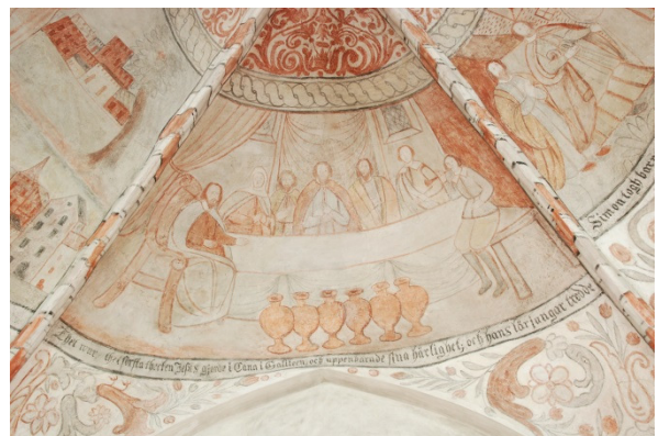
Bröllopet i Kana (norr). Text: "The twar thet första tecken Jesus gjorde i Cana i Galileen, och uppenbarade sina härlighet; och hans lärjungar trodde"