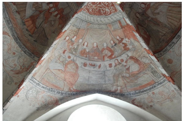
Nattvarden (söder) Text: "Tå niu afton wart och Jesus satte sigh till bords medh the tolf Apostlarne sathe han till them, jagh hafwer medh mykin åstundan begärat äta Paschalamber”