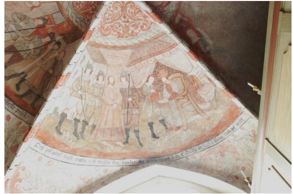
Pilatus tvår sina händer (söder) Text: "Och Pilatus togh watn och twädde sina händer för folchena och sathe, Oskyldig är jagh i thena mänhes blodh"