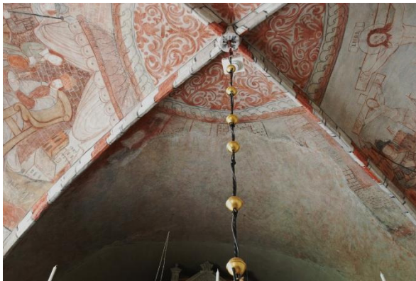
Delvis utplånad, troligen begravningen eller uppståndelsen (väster). Den ganska tjocka överlagrande putsen är infärgad 1941-42 för att ge ett intryck av de försvunna målningar som inte kunnat rekonstrueras.