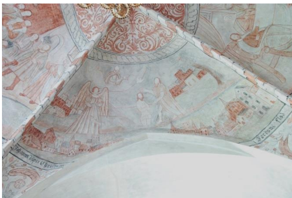
Jesu dop (väster). Text: "Johannes döper Christum i Jordans flod"