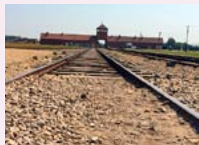
Den kända vyn från Birkenau, dit människor transporterades för att avrättas.

Nu blev det inte bara historia som i Auschwitz-Birkenau utan vi fick också uppleva det som görs för utsatta människor i dag, dessutom ett fantastiskt natursceneri i Polens första nationalpark.