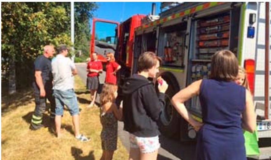
Räddningstjänsten var på plats och visade upp en brandbil för alla nyfikna stora och små.