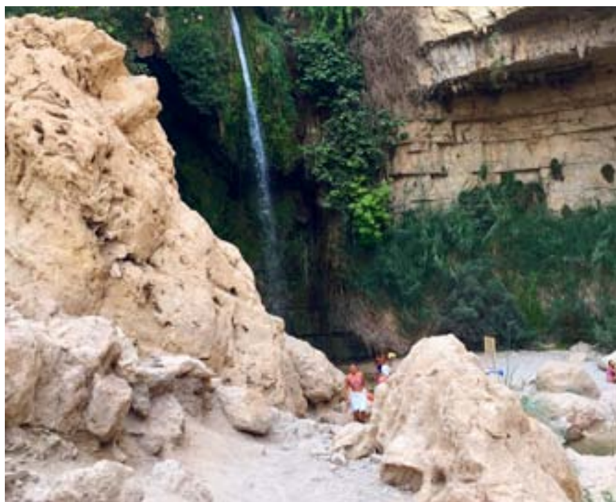
Kan detta ha varit Edens lustgård? Det finns forskare som ser naturreservatet En-Gedi som en trolig plats.