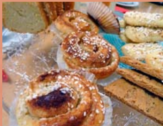
Kaffe med dopp är en självklarhet i samband med auktionen.

Gåvor till kvällens försäljning mottages tacksam.