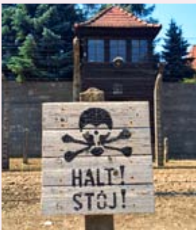
Ett av vaktornen i Auschwitz. Om en fånge försökte fly fanns det tungt beväpnade vakter och taggtråd som effektivt hindrade friheten.

Det roligaste tyckte jag var flotturen på floden som gränsar mel-