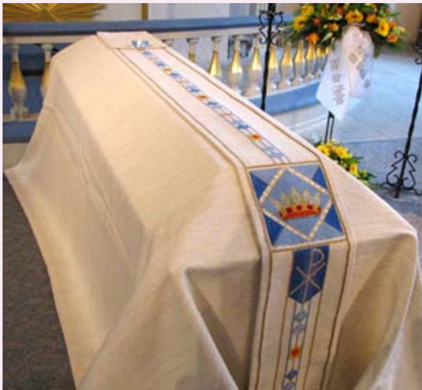
Alla som har begravningsgudstjänst i någon av kyrkorna i kommunen kan låna det vackra bårtäcket att pryda kistan med.