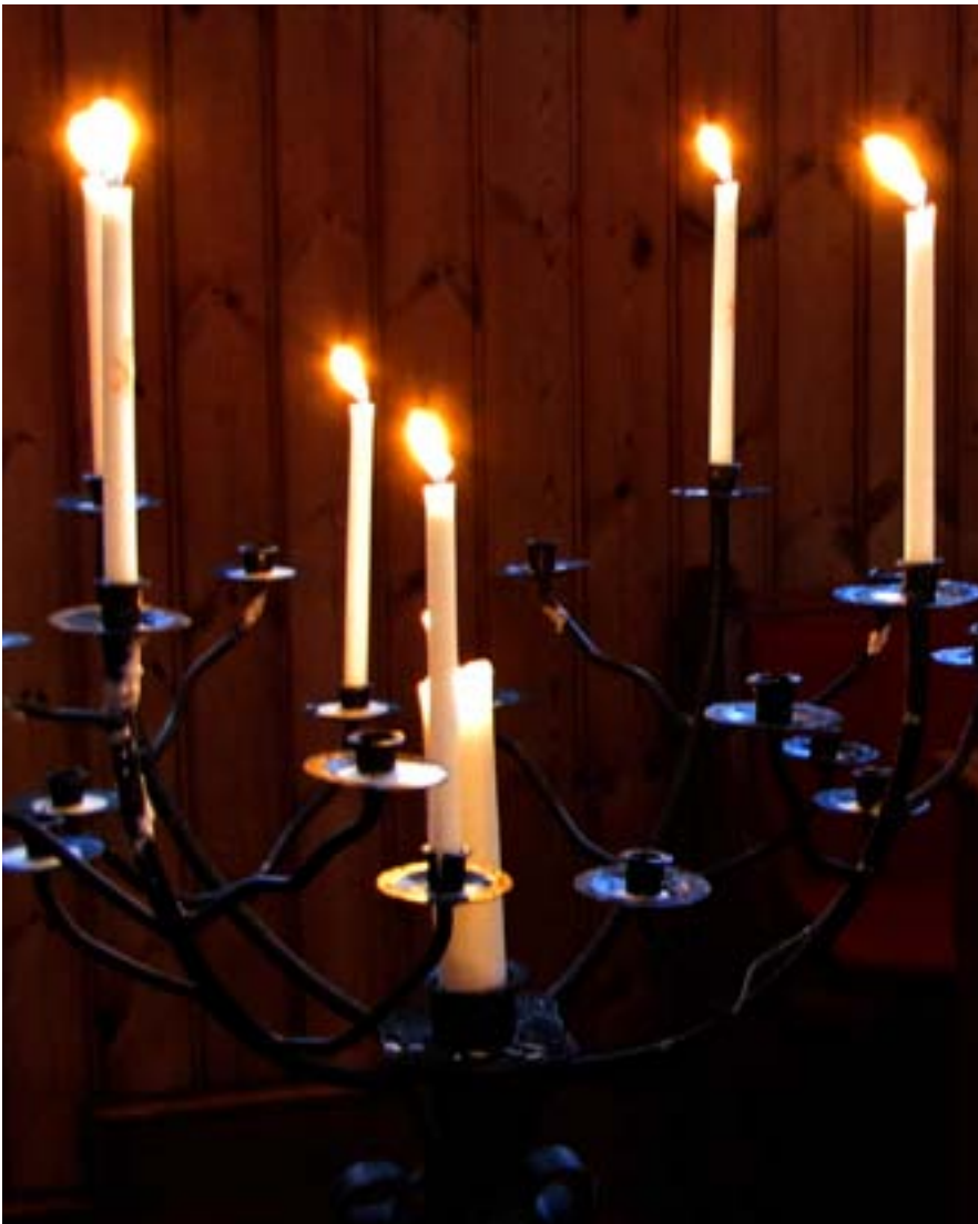
Vid tacksägelsen tänds ljus i ljusbäraren för den avlidne. Det här är ljusbäraren i Nykyrka kyrka.

i stort sett som följer, men vissa avvikelser kan ske, liksom att musik och psalmer kan ha annan placering.