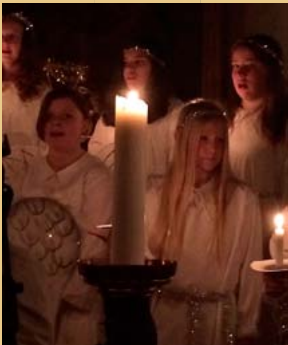
Ljuset är starkare än mörkret!

Är du inte med i vår verksamhet men vill vara med i luciatåget? Kontakta kantor Stefan Skytt, telefon 0392-130 36, SMS 070-657 82 66, e-post stefan.skytt@svenskakyrkan.se