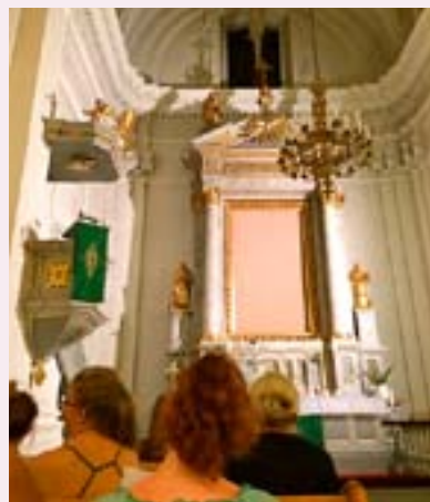
Under veckan i Krakow lånade vi St Martins kyrka på kvällarna, det blev "vår kyrka" där vi frade mässa tillsammans.

rum på ett enkelt vandrarhem med fem tjejer, hur skulle det gå?