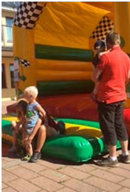
De båda hoppborgarna var minst sagt populära bland våra unga besökare.

Höstens alla aktiviteter i församlingen började en solig söndag i augusti med öppet hus i Kyrkans Hus i Mullsjö där det bjöds på allt från tårtkafé till seminarier och äventyrsvandring. Alla åldrar kunde hitta något som intresserade!