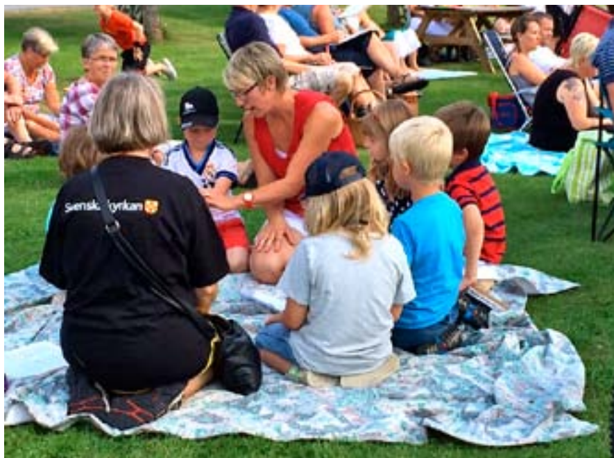
Barnen laddar upp inför framträdandet på musikkrysset.