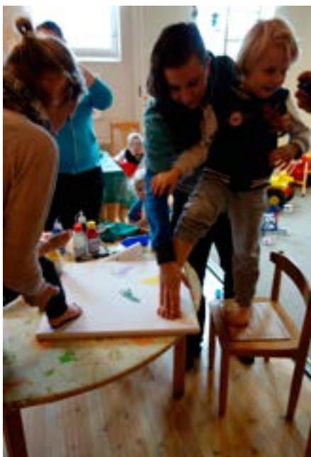
Kul på kyrkis