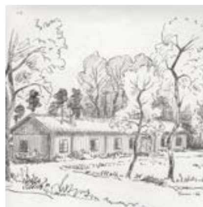
Lamperudsgården. Litografi av Sven Morfeldt 1966

Jag besökte Lamperud häromsistens. När vi suttit där med varandra en stund var