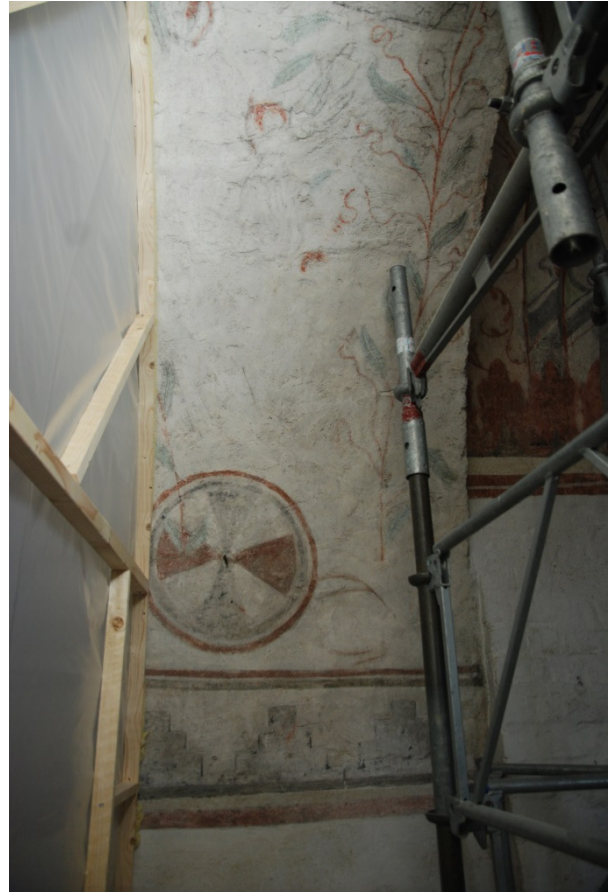
Bild 11: norra sidan av triumfbågsmuren. Till vänster om bladdekoren avbildas två stycken änglar, vilka inte är lika hårt retuscherade som mycket av det övriga måleriet, se även bild 12.