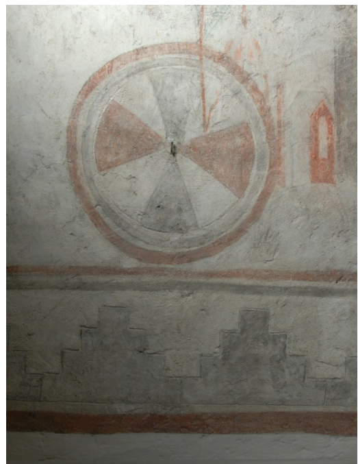
Bild 5: konsekrationsskors och trappstegsdekor från 1300-talet. Konturerna är markerade med ritsningar, vilket inte riktigt framgår av denna bild.