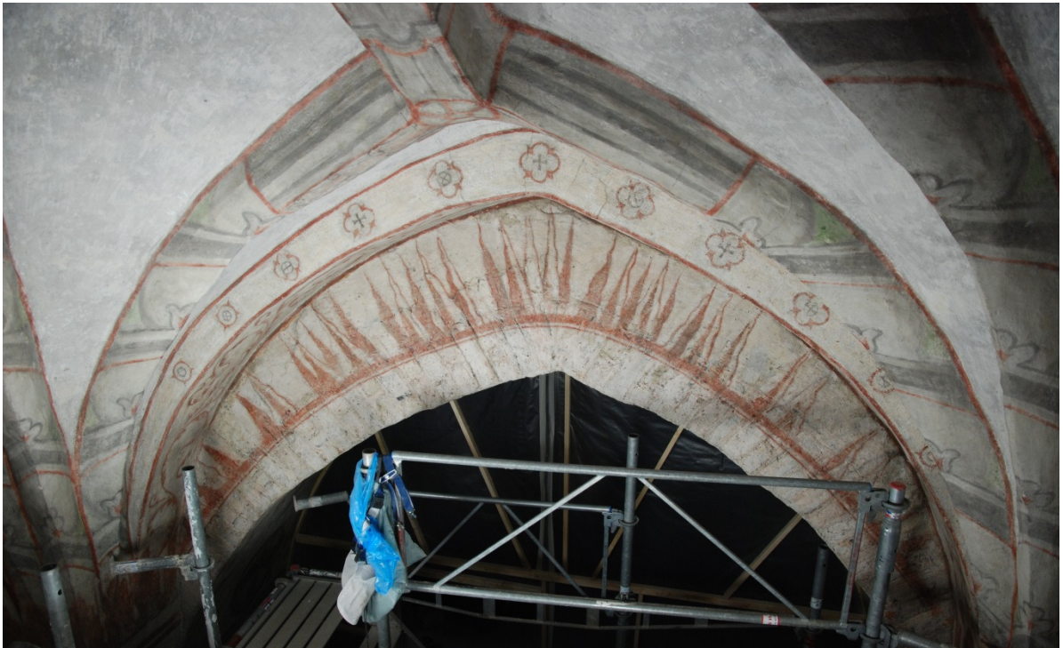
Bild 6: del av korvalvet samt triumfbågmurens västra sida. De målade "eldstungorna" hör enligt Westlund till 1300-talsmåleriet (Westlund 1962). Under dem syns ritsningarna som markerar valvteget.