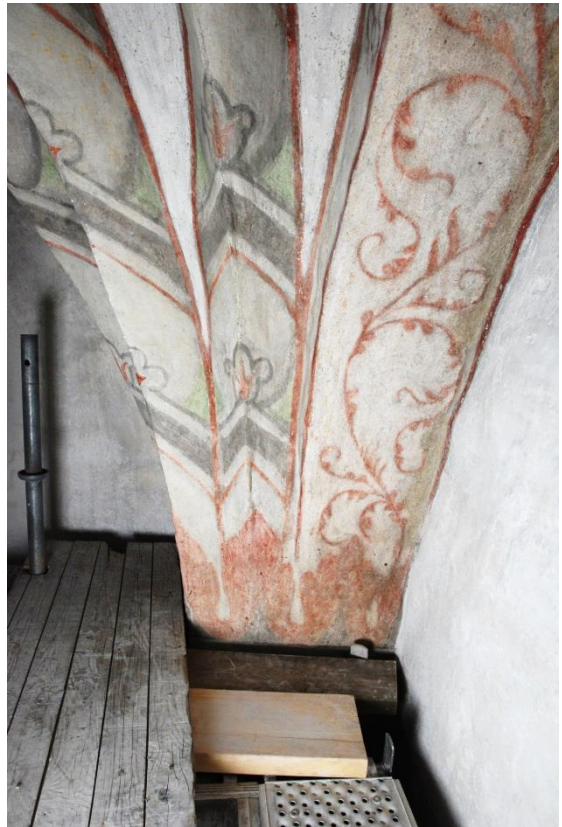
Bild 3: korets sydöstra valvanfang, notera de ljusst gröna inslagen.

Triumfbågsmurens västsida är dekorerad med motivet ”de visa och de fåvitska jungfrurna”, eller Liknelsen om de tio brudtärnorna (Joh. 25:1-13), vilket förekommer i senmedeltida måleri som en anspelning på Domedagen. Målningarna dateras till senare delen av 1500-talet, men är till största delen rekonstruerade.