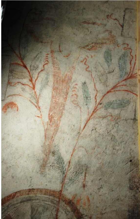
Bild 10: södra sidan av triumfbågsmuren. Bladdekoren går ned över konsektrationskorset. En möjlig orsak till detta kan vara att korset var övermålat när 1500-talsmåleriet tillkom, och att bladstängeln bevarats när måleriet framtogs 1917. I vänsterkanten skymtar del av en förmodad textkartusch.

Insidan av triumfbågsmuren har, förutom de ovan nämnda konsektrationskorsen, också målningar från 1500-talet. De består av tunna grenverk med päronliknande frukter, ett par textkartuscher (utan bevarad text) samt på den norra sidan två stycken änglfigurer (bild 10-12). På den södra sidan avbildas några hus och torn, kanske en bild av det himmelska Jerusalem.