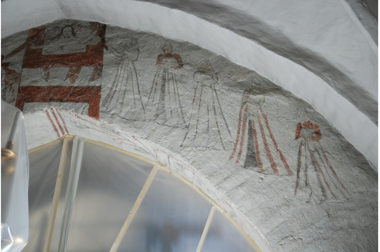
Bild 8: de fåvitska jungfrurna. Ritsningarna i putsen följer triumfbågsmuren nästan ned till golvet.