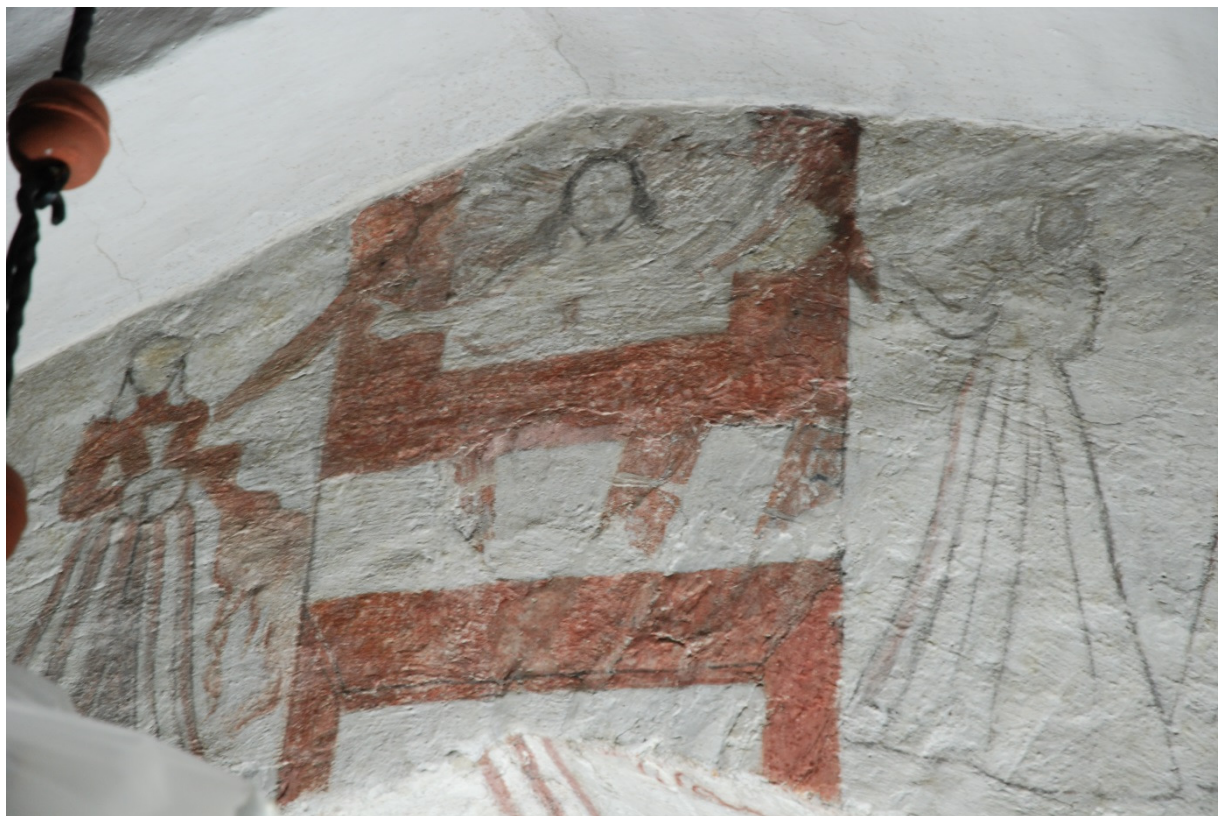
Bild 9: mitten av triumfbågsmurens västra sida, med Kristus som domare på Yttersta dagen.