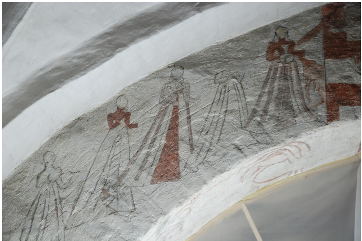
Bild 7: de visa jungfrurna. Under det hårt retuscherade 1500-talsmåleriet syns äldre ritsningar i putsen.