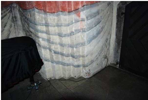
Exempel på skrap- och slagskador på draperimålningen

Besiktningdatum 2015-08-27 Foto Gunnar Nordanskog där inget annat anges. Rapport sammanställd av Gunnar Nordanskog 2015-11-09 Granskad av Eva Ringborg