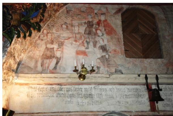
Västväggen, östra delen. Josef och hans bröder.