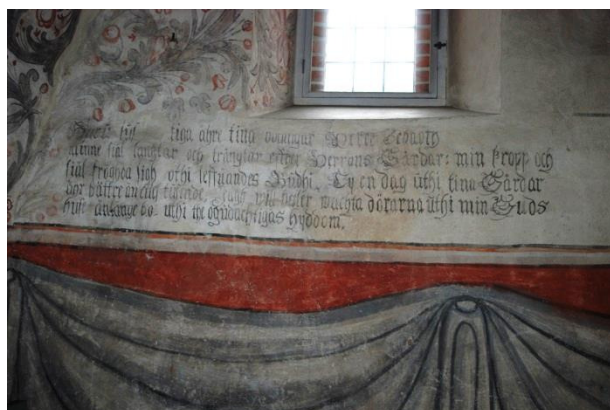
Sydväggen, östra delen, Ps 84.