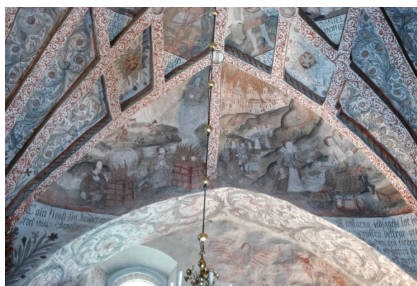
Korets södra valvkappa: Kain och Abel, Lot och hans hustru.