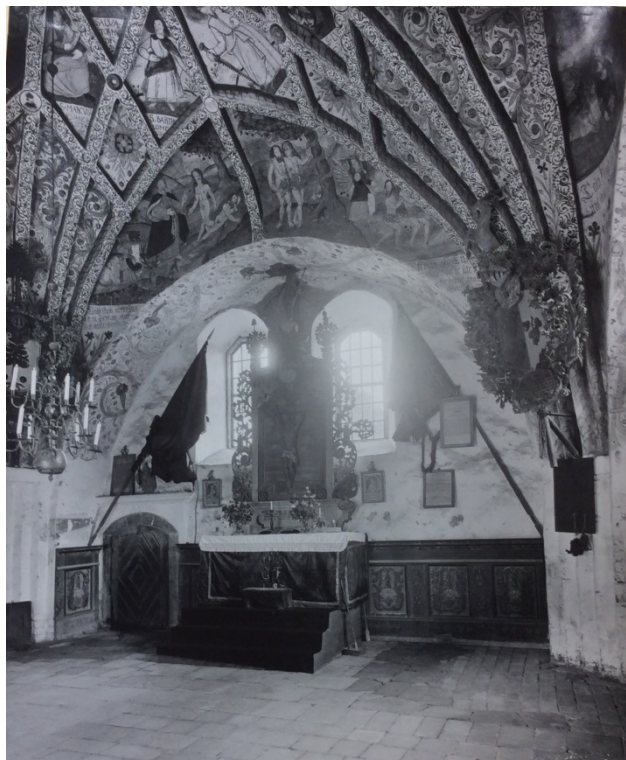
1927: koret som bisättningsrum

Vid 1943 års konservering upptäcktes också 1400-talsmålningar på väggarna (ÖC). Av detta finns idag ingenting synligt.