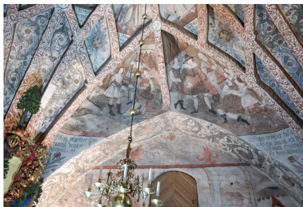
Korets norra valvkappa: Josef tyder faraos dröm, Josefs bröder faller ned inför honom.