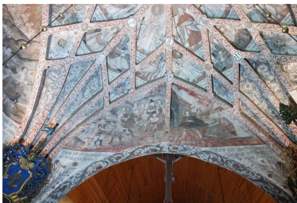
Korets västra valvkappa: Josef säljs av sina bröder, Josef och Potifars hustru.