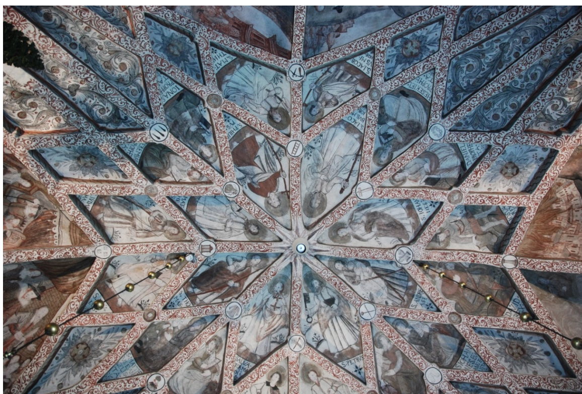
Stjärnvalvet i koret. Öster är nedåt i bilden.

Stjärnvalvets alla kassetter är bemålade med figurer eller blomsterdekor. Högst upp avbildas apostlar och profeter och längst ned i valvkapporna finns scener ur gamla testamentet. I skärningspunkterna mellan valvribborna är olika martyrredskap avbildade och i valvets hjässa syns en strålende sol med inskriften Jehova med hebreiska bokstäver. Målaren har (precis som i Furingstad) noggrant beskrivit både figurer och scener med texter, vilket gör de ikonografiska bestämningarna ovanligt enkla.