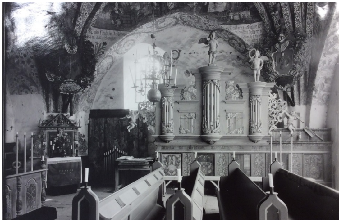
1934: koret som gudstjänstrum