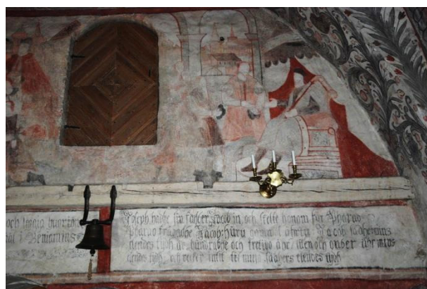
Västväggen, västra delen. Josef för Jakob inför farao