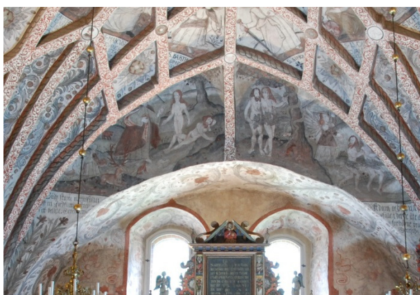
Korets östra valvkappa: Gud skapar människan, utdrivandet ur Paradiset.

Norra valvkappan: Josef uttyder Faraos dröm; Josef inför sina bröder i Egypten; apostlarna Paulus, Judas Taddeus, Matteus och Thomas; evangelisten Matteus och profeten Jeremias.