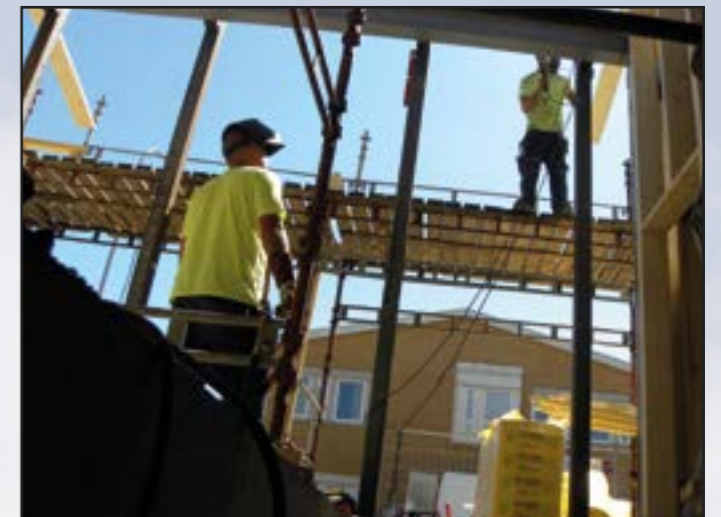
Den nya entrén har här fått sina stålbalkar snart på plats. Till höger skimtar vi också dörröppningen till andaktsrummet från entrén. 2015-06-12