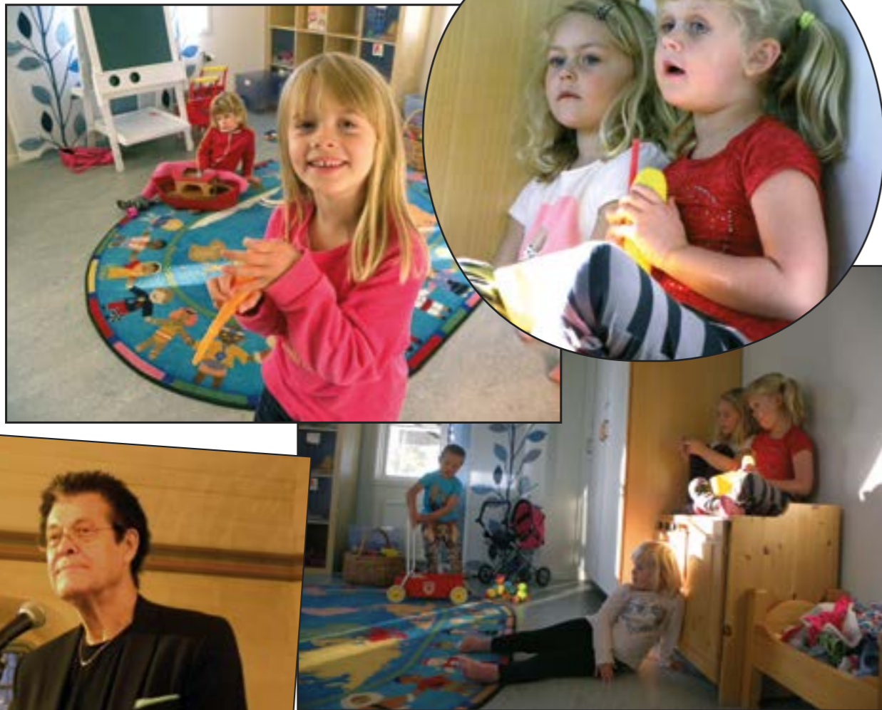
Barntimmar i Stora Mellby församlingshem.