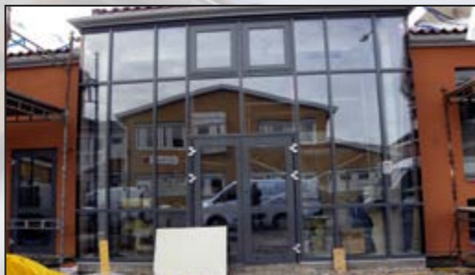
Entrén på plats. Fasaden har även fått sin färg. 2015-09-21