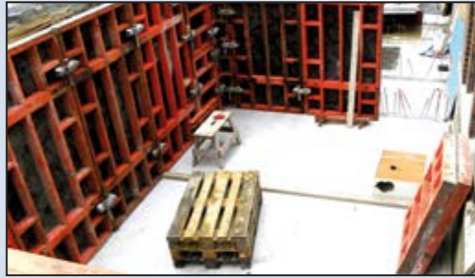
Här gjuts väggar till det nya rummet, här kommer det bli ett rum för barn och ungdom. 2015-04-17