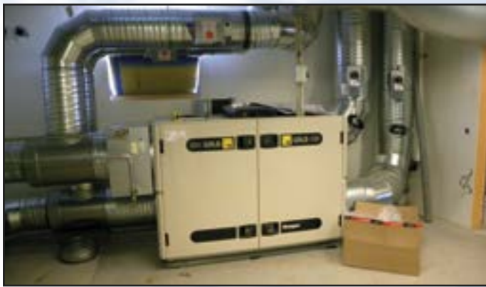
Fläktsystemet behöves förbättras. Ett nytt system kommer på plats och nya fläktrum har kommit till. 2015-06-22