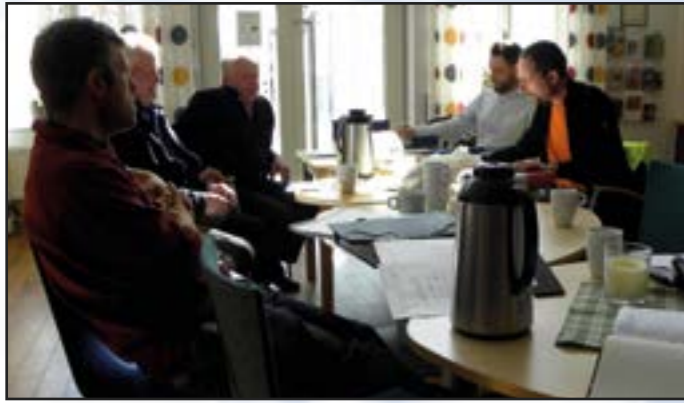
Regelbundna byggmöten har hållits på pastorsexpeditionen. 2015-04-13