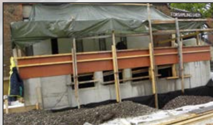
Ett våningsplan till har påbörjats samtidigt som man håller på med att öppna till hallen inmanför. 2015-05-19