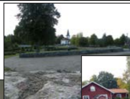
Nya kyrkogårdsmuren i Långared är klar och en ny stor parkering finns intill församlingshemmet.