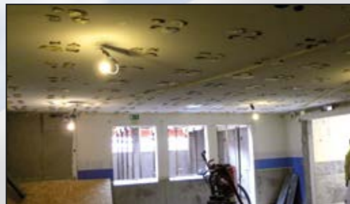
Hela tiden sker det arbete inomhus. Här har man tagit upp dörren till det nya rummet i barn och ungdom. 2015-05-12