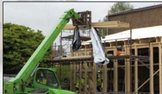
Andaktsrummet har fått början till väggar och tak. 2015-05-22