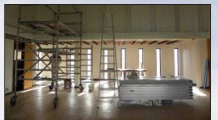
Målningsarbete i stora salen. Alla tak och väggar är snart grundmålade. 2015-03-31