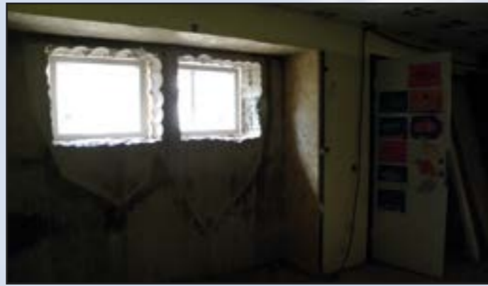
Nya fönster i barn och ungdomslokalerna, här i väggen mot pastorsexpeditionen. 2015-06-26