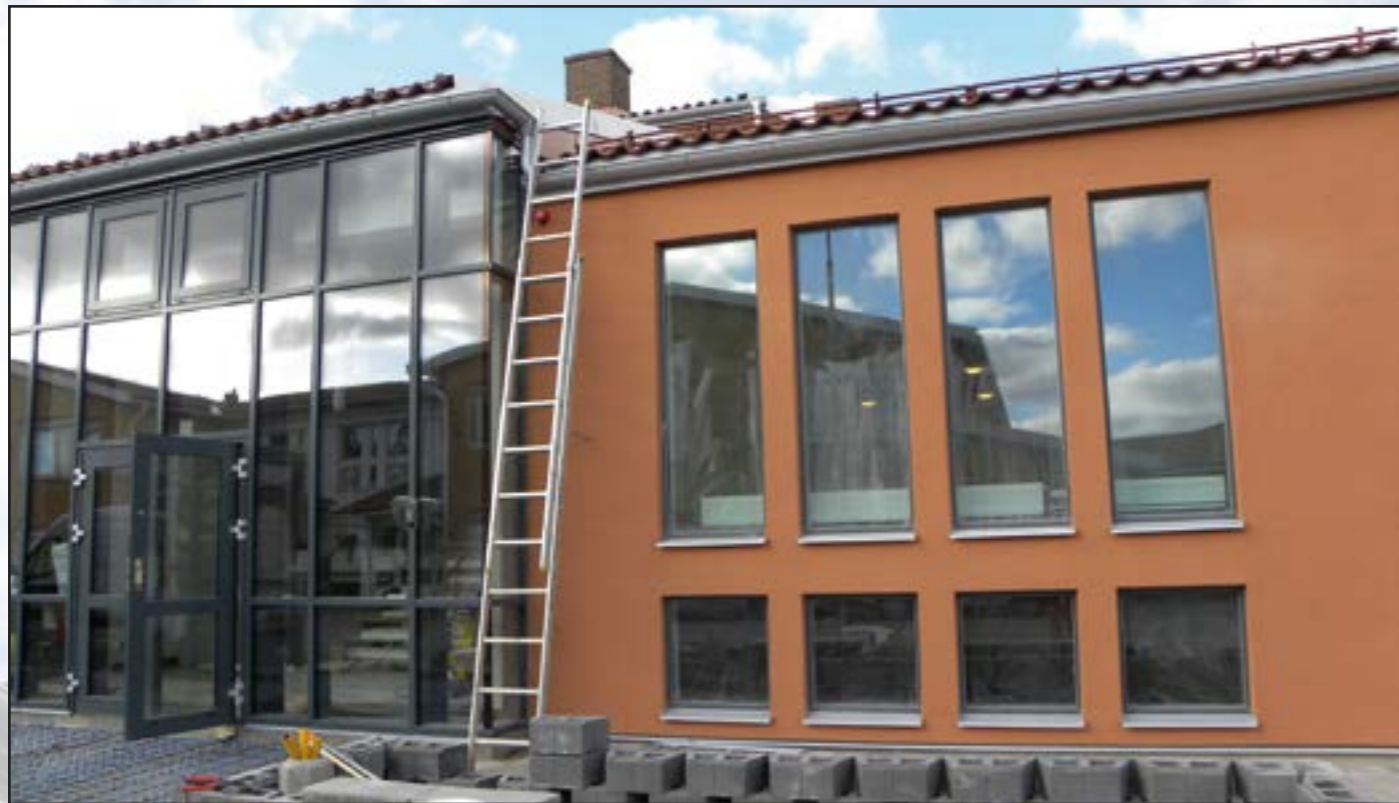
Framsidan av församlingshemmet strax innan det var dags för stenläggning. Här finns redan känslan av vad fint det kommer bli när allt är klart.