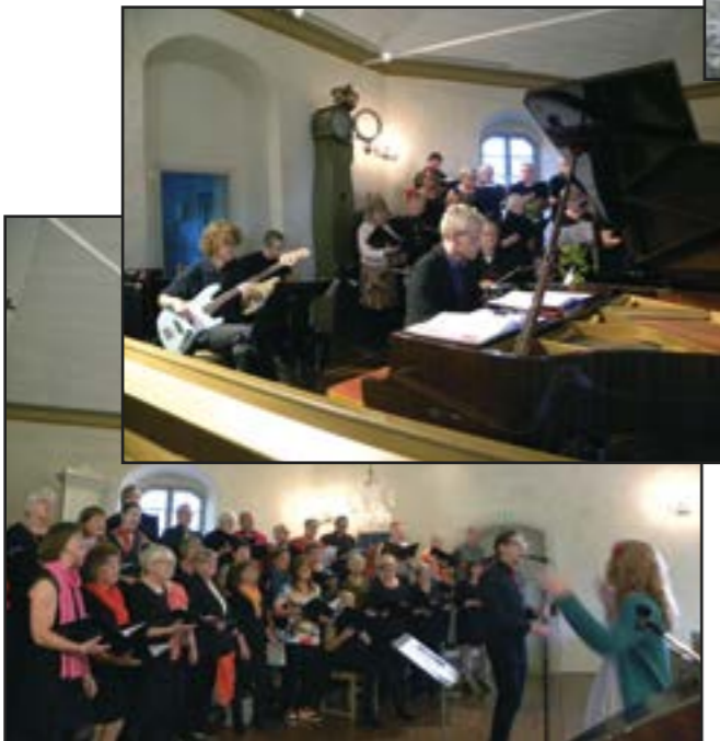
Fantastisk lyckat André Crouch projekt med musik och sång i Stora Mellby kyrka 27 september