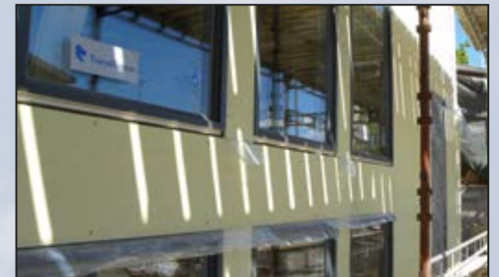
Fönster på plats. Här har vi fått fönstren till andaktsrummet monterade, väggen kvar och platsen där man skall kunna gå in från gatan syns till höger. 2015-06-09