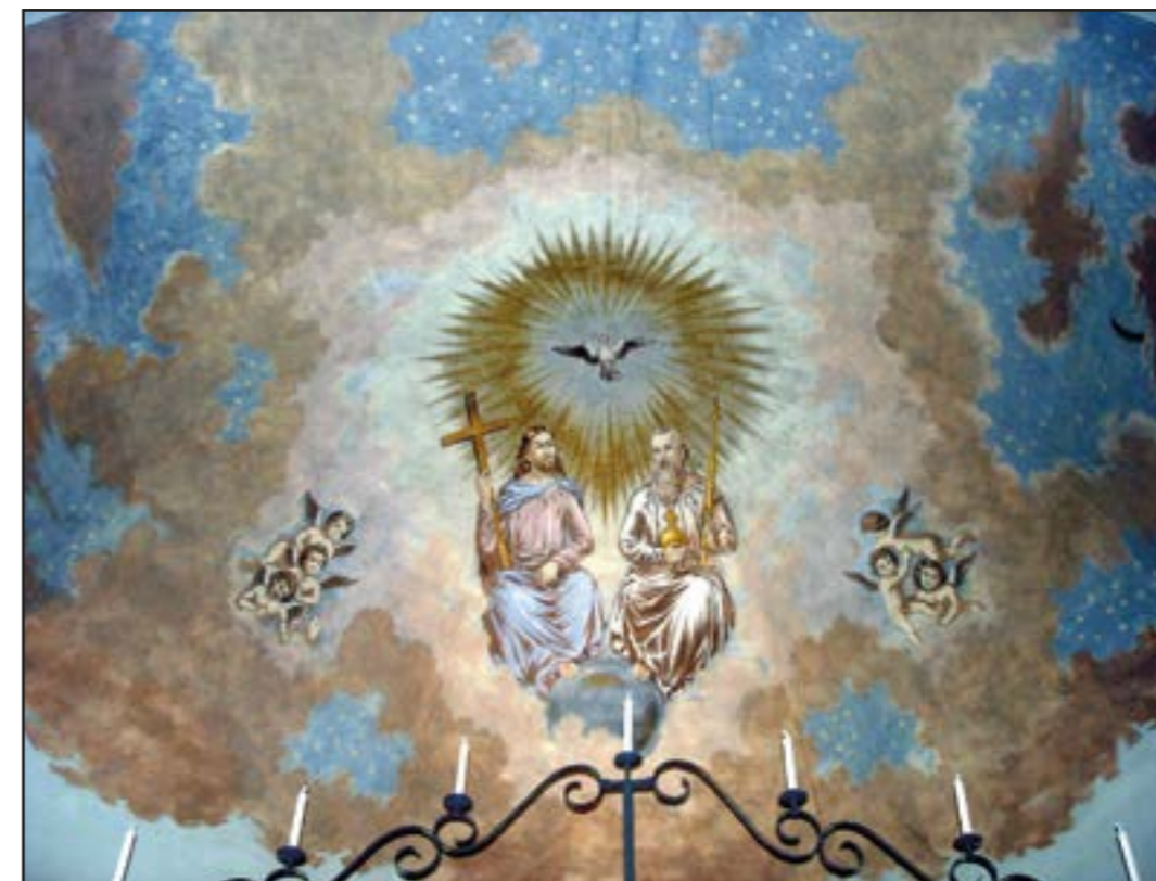
I konsten avbildas Gud ofta som en vitskäggig man på ett moln. Den bilden kan lätt begränsa våra tankar om vem Gud är.

Men Gud går inte att registrera på det sättet även om Gud verkar. Gud finns inte. Gud är. Det betyder att Gud inte går att begränsa. Gud är alltid större än våra egna begränsade möjligheter att tala om Gud. Och ändå så talar vi om Gud och benämner Gud som Fadern eller Skaparen.