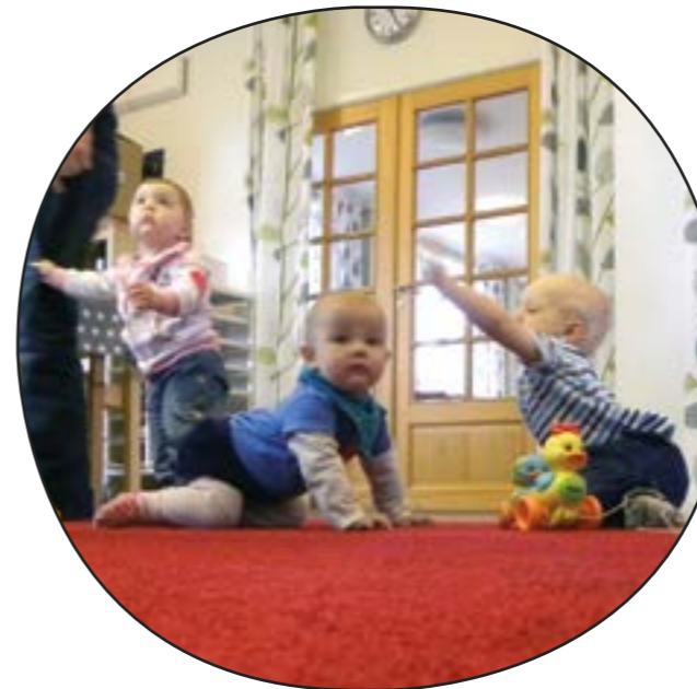
Efter önskemål från föräldrar har bjärke församling nu startat en Småstund även i Stora Mellby. På bilden till höger, fick föräldrar och barn pyssla egna shakers. Samlingen innehåller även sångstund och fika.