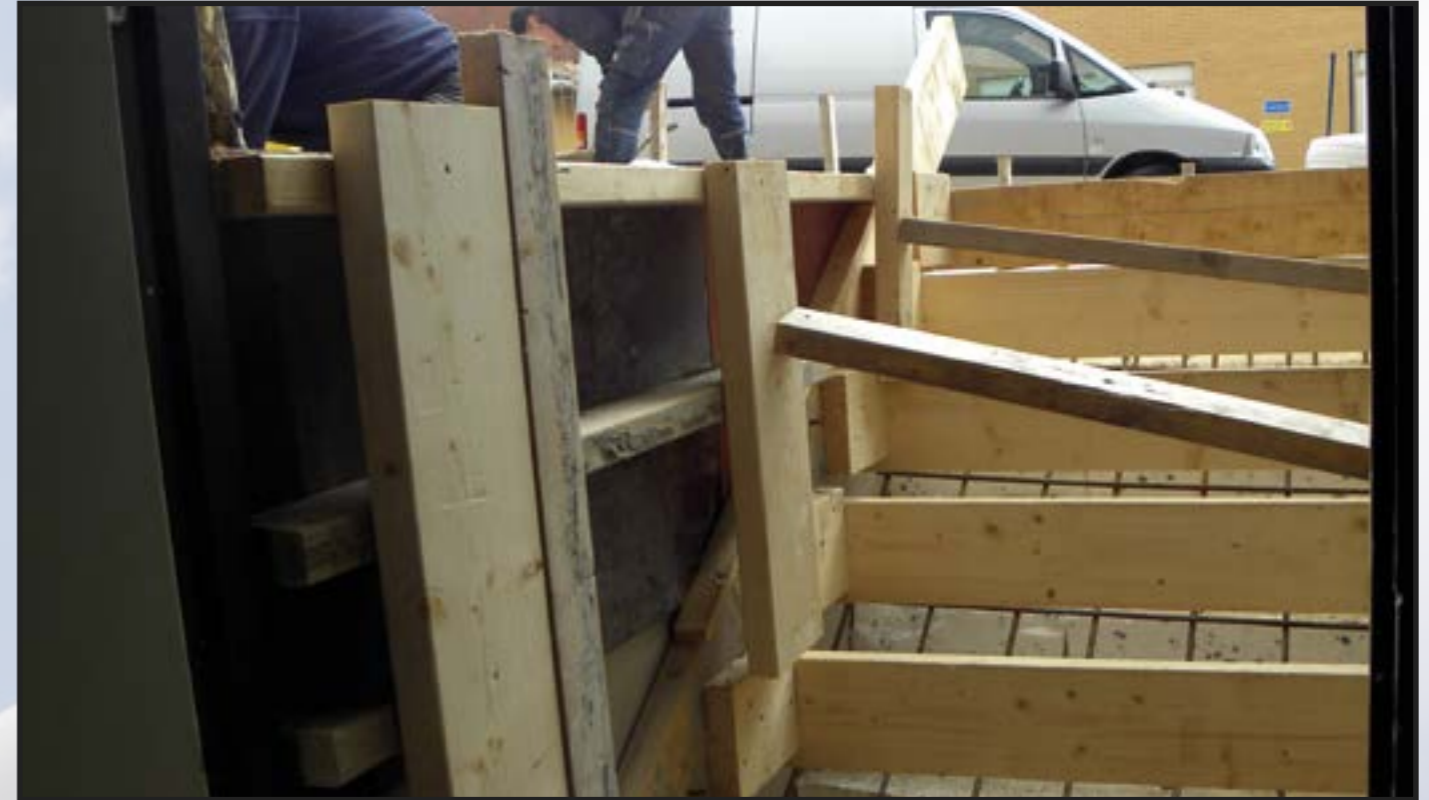
Trappan ner till barn och ungdom är på plats. Här ser vi redan att vi får en bättre ingång från framsidan. 2015-05-26