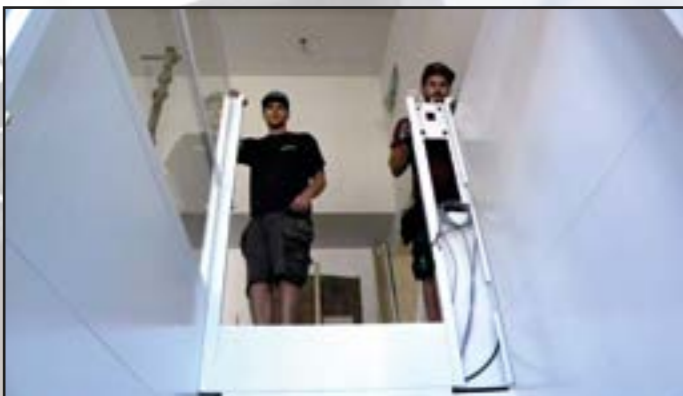
Nytt i församlingshemmet är att vi får en hiss vilket ger möjlighet att inomhus ta sig till alla våra lokaler. 2015-08-18