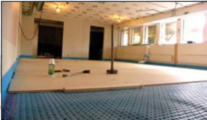
Vikväggen i bottenvåningen är borta. Nytt golv läggs och i bakgrunden ser vi öppningarna till de nya stora förråden, 2015-07-06