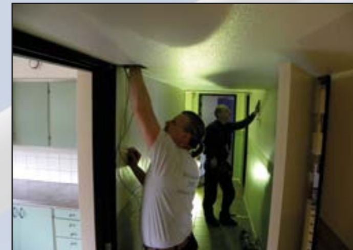
Byggstart. Efter veckor av flytt och magasinering, kom arbetet igång. Kablar skall bort och nya skall dras. 2015-02-26