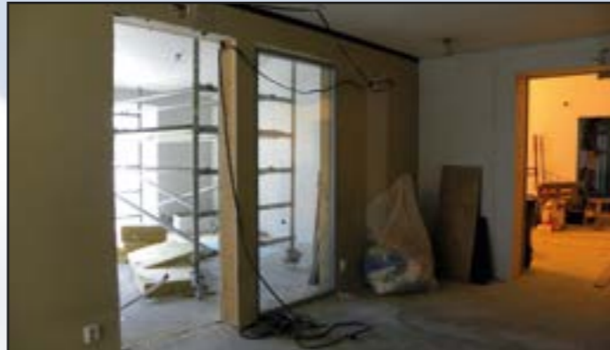
Här ser vi det som skall bli bland annat samtalsrum. Här är arbetet igång efter semester igen. 2015-08-04