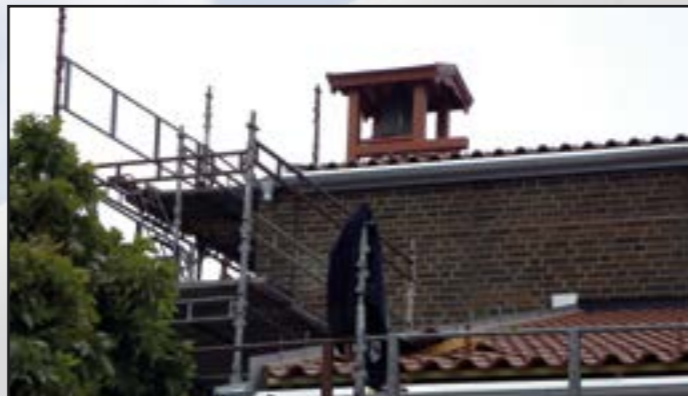
Vi har fått en vacker klocka på taket. Nu har även takpannor kommit på plats. 2015-08-24