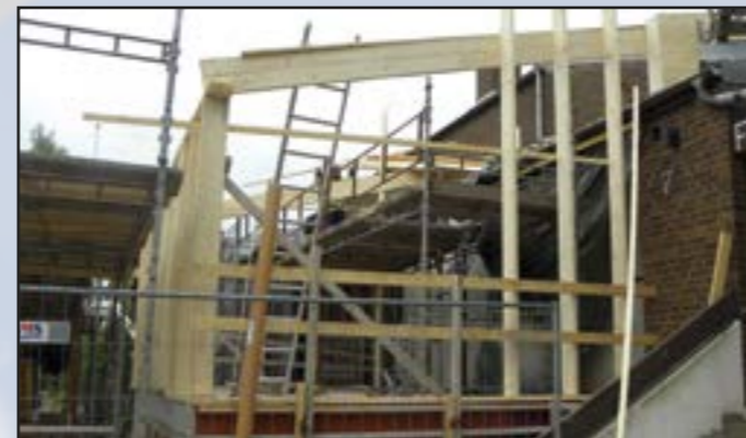
Ovanför det nya rummet i barn och ungdom kommer det finnas ett rum som skall fungera som bland annat samtalsrum. Här är trappan på sidan fortfarande kvar. 2015-06-02