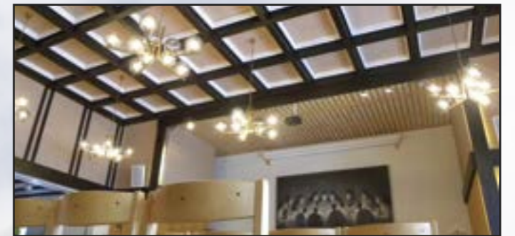
Kommer Ni ihåg det markerade rutorna i taket och väggar? Det var så här det var innan vi avslutade verksamheten. 2015-01-25