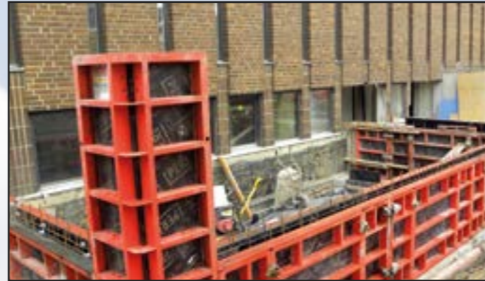
Här skall det nya andaktsrummet vara. Den murade väggen bakom är nu en del av interiören och de smala fönstren finns fortfarande kvar mot stora salen. 2015-04-30