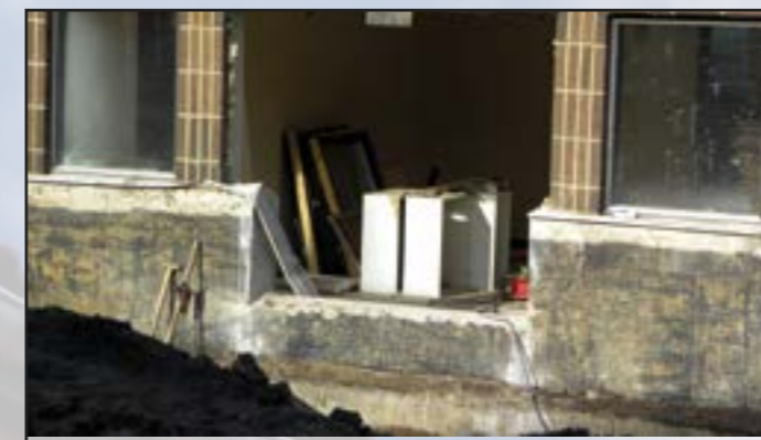
Ett stort hål togs upp i väggen och runt detta har sedan den nya utbyggnaden under ett halvår tagit form. 2015-03-24