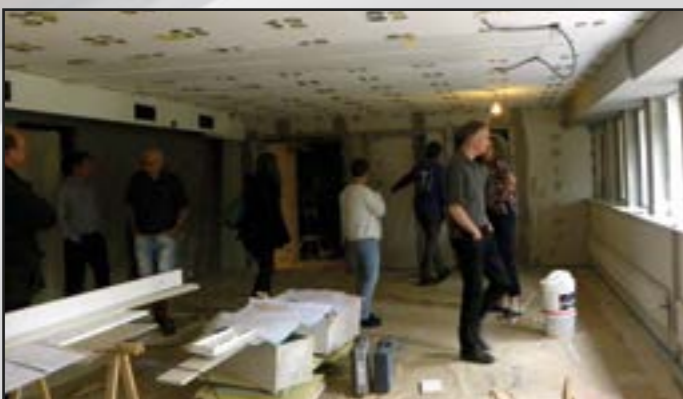
Personalen går på inspektion. Nu kan man se hur lokalerna kommer att se ut. 2015-08-27