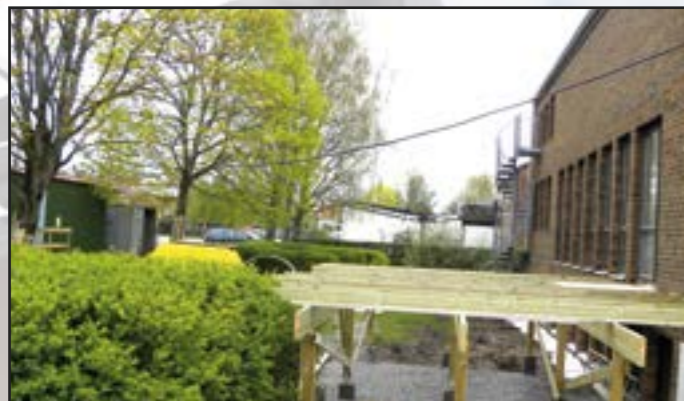
En efterlängtat altan byggs på baksidan mot stora salen. 2015-05-05