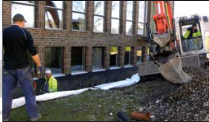
Här pågår dräneringsarbete på baksidan av församlingshemmet. 2015-04-21