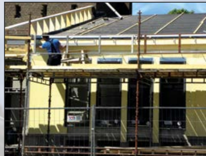
Under några dagar tog det fart på bygget, eller rättare sagt nu kunde vi se den form som det skall bli. 2015-06-10