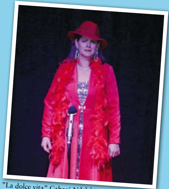
"La dolce vita" Cabaré NÄÄÅSET

Jag finns med när vi tillsammans med andra föreningar firar Nationaldagen. I samband med att vi hyr ut lokalerna till dop-fester, mottagningar m.m. visar jag lokalerna, var allt finns och förklarar hur disk- och kaffemas-kinerna fungerar.