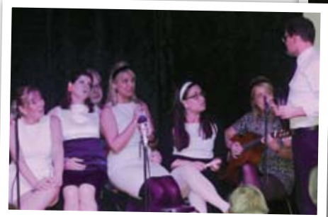
60-talet återupplivades för denna kvällen.