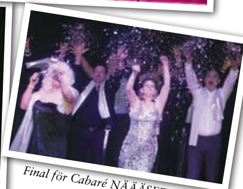
Final för Cabaré NÄÄÄSET!