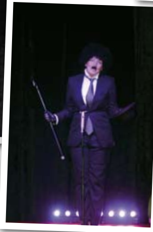
Mariannes uppskattade tolkning av Charlie Chaplin.