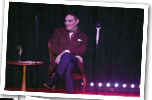
Vår kyrkoherde framför "Vad skönt att man inte är ung"