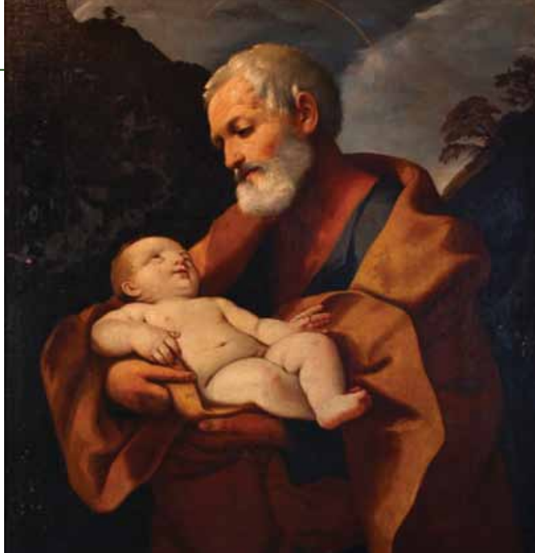
Josef, drömmaren från Nasaret.

Visst är det ett annorlunda julspel, denna kantat, och nog finns julens händelser i centrum, men det är också en spännande berättelse om Josef, drömmaren från Nasaret. På Trettondedag Jul upplever vi den i Tensta kyrka.