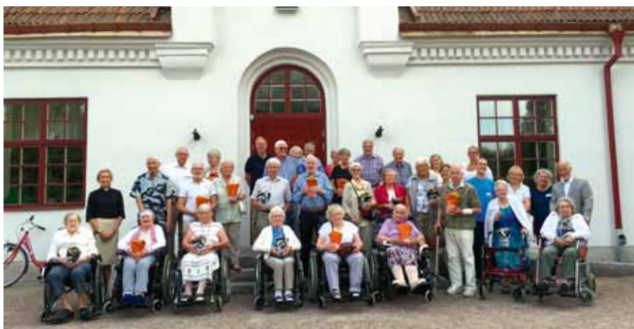
Den här glada gruppen seniorer hörsammade församlingens inbjudan till 80-årskalas i somras. Alla som fyllt 80 och däröver inbjöds till kaffe och tårta i församlingshemmet. Det blev en trivsamt eftermiddag och kalaset slutade med fotografering vid trappan.

Onsdagen den 16/12 bjuder vi in till adventskaffe i Trekanten för alla som fyllt 80+. Det blir hembakat med smak av julens kryddor och barnkören sjunger julsånger för oss. Hör av er till oss om ni behöver hjälp att ta er till Trekanten.