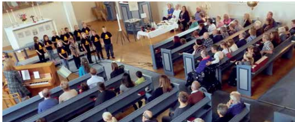
Barnkören Hör & Häpna sjöng vid gudstjänsten i Ursvikens kyrka söndag 4 oktober. Vid samma tillfälle var det också en skördeauktion.

Under rubriken "Backspegeln" får du veta en del av det som hänt under de senaste månaderna.