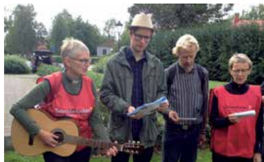
Under pilgrimsvandringen var det några sångstunder samt tid för vila och samtal.

– Jag har gjort pilgrimsvandringar tidigare men aldrig så här inne i ett samhälle. Sedan är det trevligt att få träffa andra och kanske lära känna någon ny. Men också att hinna fundera över mål och riktning här i livet.