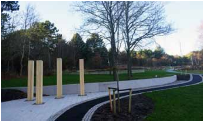
Askgravlunden på Hönö kyrkogård är utformad av arkitekt Bo Larses på Mareld Landskapsarkitekter och entreprenör är HTE Garden.